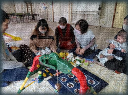
【子育て伴走型相談支援】