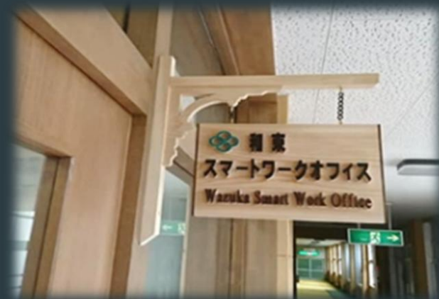
【和束スマートワークオフィス】

魅力的な茶畑景観と豊かな自然環境を基盤とし、新しい暮らし、充実した子育て・教育環境、そして利便性の高い交通ネットワークを整備することで、多様な世代・層から持続的に選ばれる「茶源郷和束」を確立していく事業です。