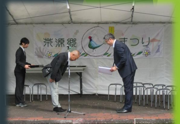
【茶源郷まつりでの感謝状贈呈式】

更に、寄附企業様の名称、寄附金額等については、 町のホームページ等に掲載 させていただきます！