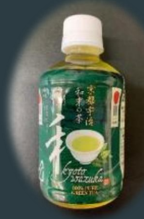
【和束茶ペットボトル】

「和束ファン」獲得に向けて、本町のお茶を通じた様々な魅力を最大限引き出し、5感で感じ、体験することで記憶に残るまちづくりを進めるほか、鷲峰山トンネル開通によるメリットを生かし、新しい事業を展開し、ブランド化を促進するとともに、茶産業を軸に町内での雇用環境を整備し、訪れる場所だけでなく、働く場所としての価値を生み出す「茶源郷和束」を確立するための事業です。