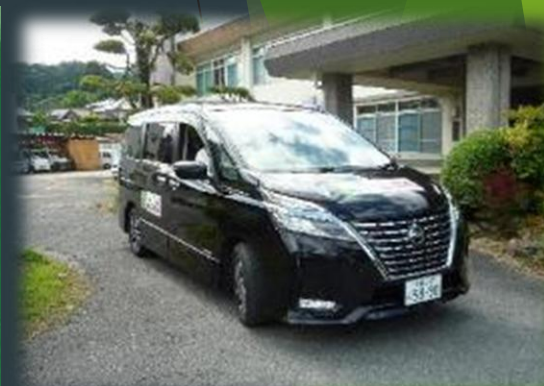
【茶源郷乗合交通ワヅカー】