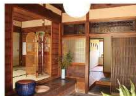
長い年月を経た趣のある空間