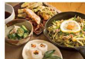
心のこもった手料理