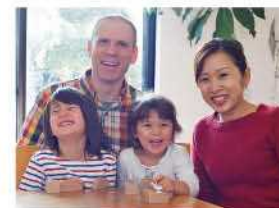
宿主 プロジェクトさん家族