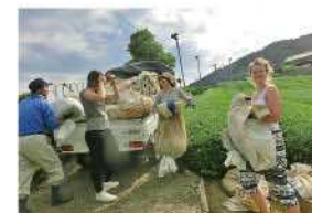
農作業体験の様子