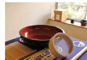
茶そば打ち体験もできます