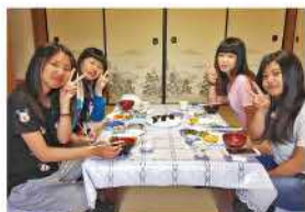
地元食材を使った料理を楽しむ宿泊者