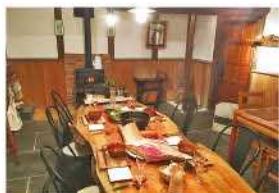
カフェ店内の様子