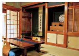
古民家を利用した純和風の室内