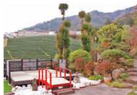
カフェテラスからの眺め