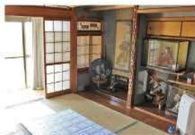
伝統的な日本家屋の客間