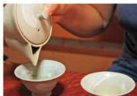
自園のお茶を飲み比べ