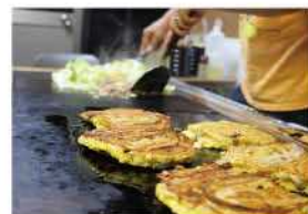
自慢のお好み焼き