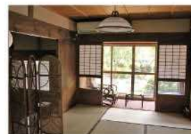
落ち着いた雰囲気の客間