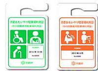
利用証のデザイン