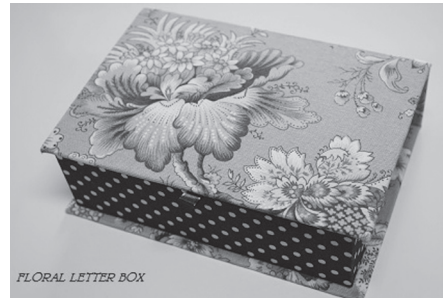
FLORAL LETTER BOX サイズ 19cm×13cm×高さ6cm

実施日 8月22日(金) 午前10時～正午 場所 和東町体験交流センター 講師 北野 由美子さん(FLORAL-LETTER BOX主宰) 参加対象 笠置町・和東町・南山城村 在住・在勤の18歳以上(高校生除く) 定員 15名 参加費用 ¥2,100 【材料費¥2,000 体験料¥100】 持ち物 手拭きタオル・布切りはさみ・定規・筆記用具 申込期間 8月6日(水)～8月15日(金)