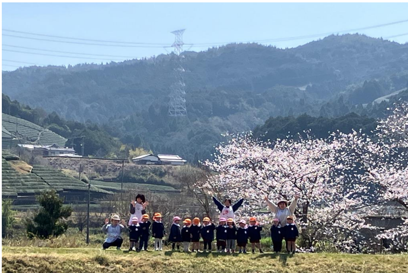
表紙: みんなで「ハイ、ポーズ」