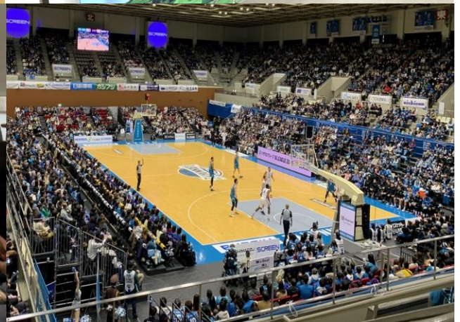
表紙: 京都ハンナリーズホームタウンデー