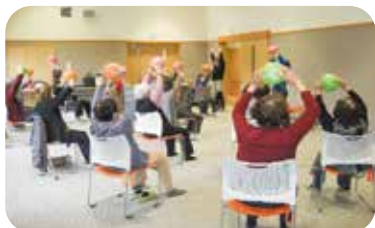
笠置町：おたっしゃくらぶ