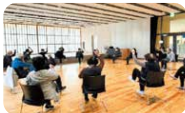
和束町：いきいき元気塾