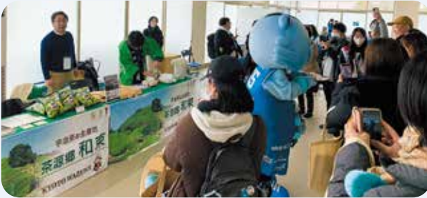
賑わう和束町PRブース

接戦となった試合は、両日とも京都ハンナリーズが見事勝利し、会場は熱気に包まれました。