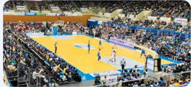
白熱した試合の様子