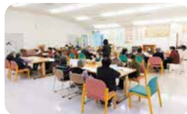
南山城村：介護予防教室