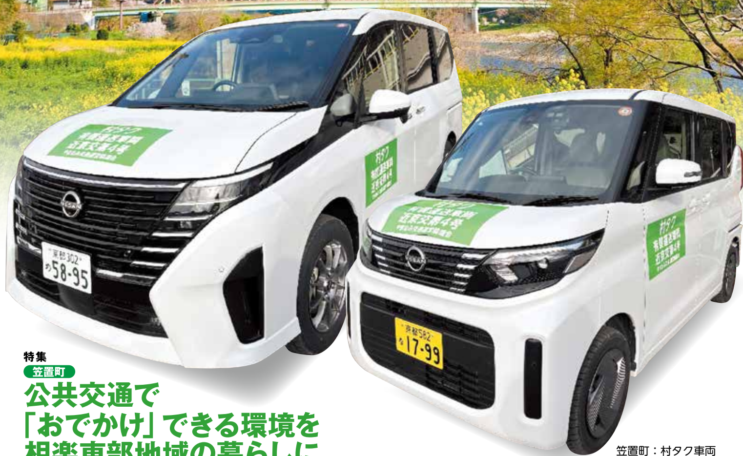
笠置町：村タク車両