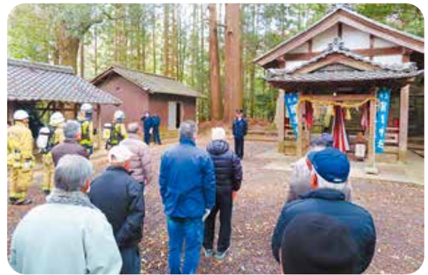
有市国津神社 (笠置町)

相楽消費生活センターは 令和7年4月28日より京都府木津総合庁舎に仮移転しました 消費生活の相談や苦情はお気軽に相楽消費生活センターへ(電話または来所) ☎0774・72・9955(フリーダイヤル) ☎188(じや) ☎188(じや) ☎188(じや) ☎188(じや) ※消費者ホットライン ☎188(じや) ☎188(じや) ☎188(じや) ☎188(じや) 相談は無料です。秘密は守ります。 ☎月～金(祝日・年末年始を除く) 午前9時～正午・午後1時～4時 〒621-0801 木津川市木津上戸18番地1