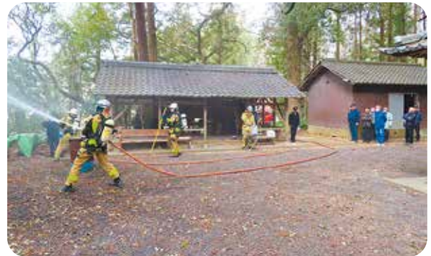
有市国津神社 (笠置町)