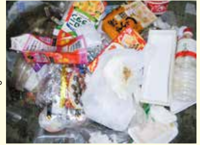
プラスチック容器包装ごみに混ざっていた紙類・ペットボトル類

笠置町・和束町・南山城村から集められたプラスチック製容器包装ごみはリサイクルされ、他のプラスチック製品の素材として生まれ変わっています。