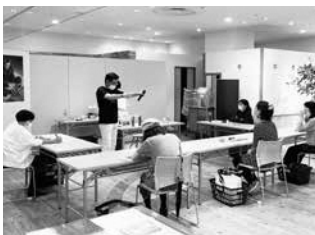
お茶の飲み比べ体験のようす ここでしか聞けない話も楽しい

初めて南山城村を知った方も多く、村に行きたいという声も多く聞かれたそう。新たな村ファンや村のお茶ファンの輪が広がっていくことを期待しています。