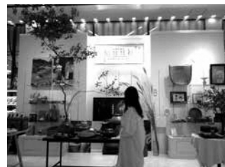
秋の山里を装った ディスプレイが好評