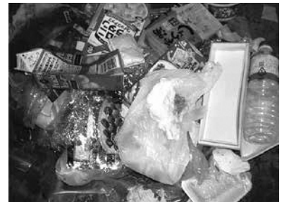
プラスチック容器包装ごみに混ざっていた紙類・ペットボトル類