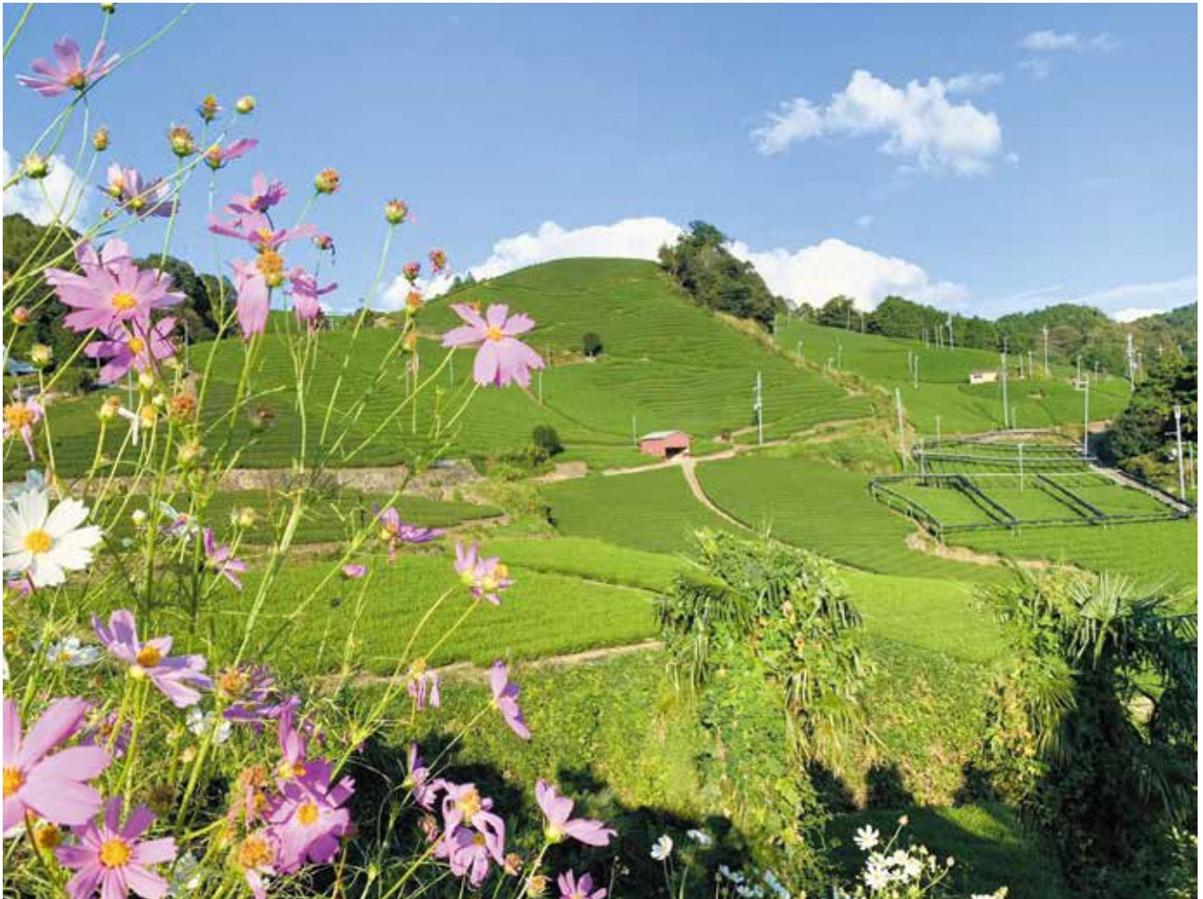
表紙写真：茶畑に映えるコスモス（和束町）