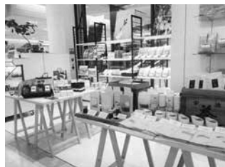
道の駅オリジナル商品や 茶農家こだわりのお茶が並び