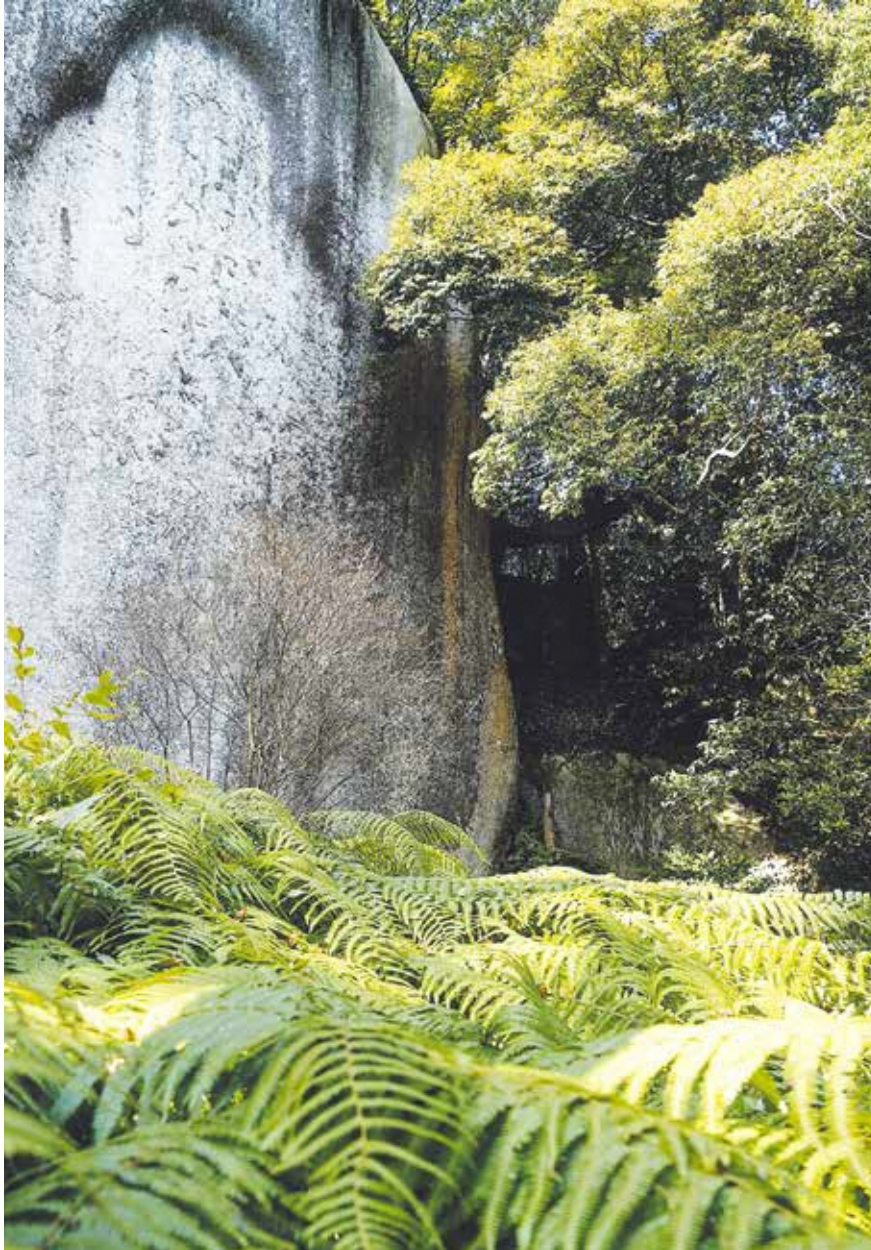
表紙写真：第13回笠置町フォトコンテスト（シダと弥勒摩崖仏 矢延直樹さん）（笠置町）