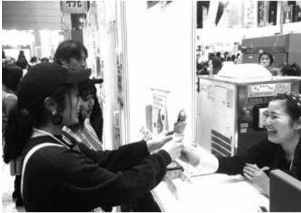
「むら抹茶ソフトクリーム」でPR (南山城村)