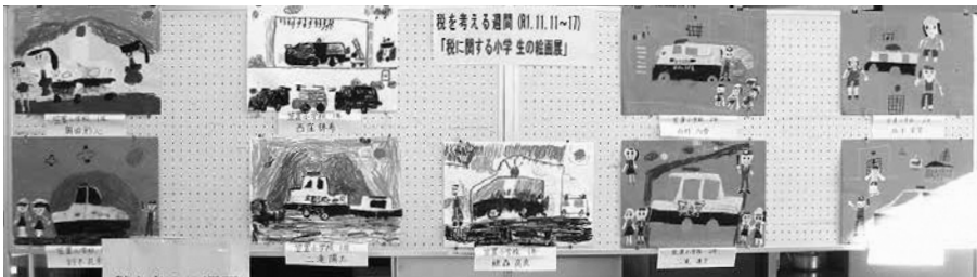
笠置町産業振興会館にて

11月11日(月)～17日(日)までの「税を考える週間」の一環として、笠置町・和束町・南山城村の小学校の児童たちが思い思いに描いた絵画作品を展示しました。