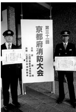
左 森地部長 右 蛭川副団長 (南山城村)