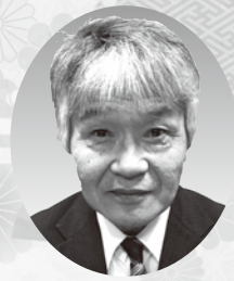
相楽東部広域連合長 笠置町長 西村 典夫