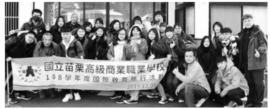
台湾からの高校生