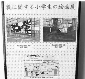
南山城村文化会館(やまなみホール)にて