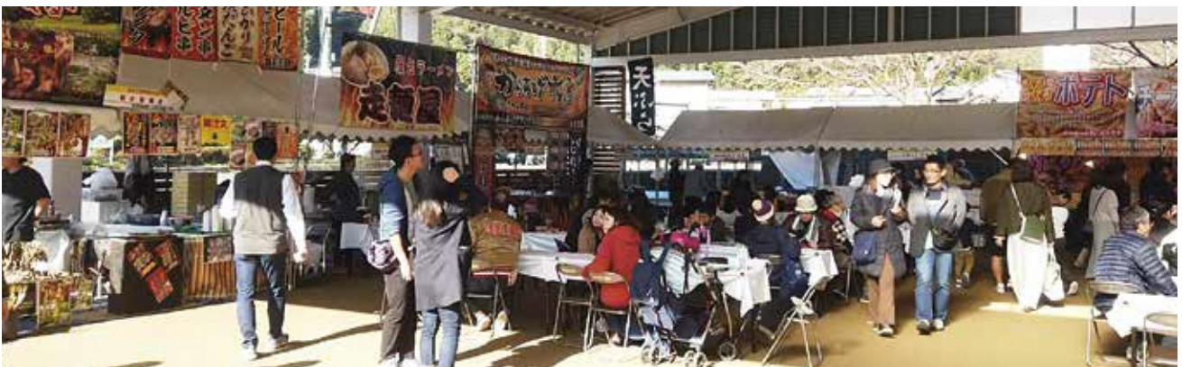
表紙写真：第10回 鍋-1グランプリ (笠置町) (※記事等詳細は4ページをご覧ください)