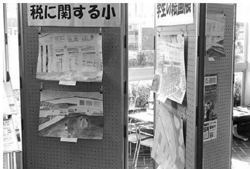
和束町社会福祉センターにて