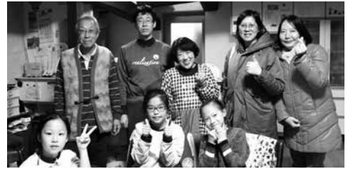
香港からの小学生