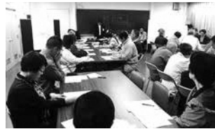
地域懇談会の様子

村民のみなさんにとってより良い交通網が形成できるよう、委員のみなさんと共に協議をしながら進めていきます。