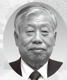
和束町長 堀 忠雄

最後となりましたが、皆様のご健勝とご多幸を祈念申し上げます。新年のご挨拶とさせていただきます。