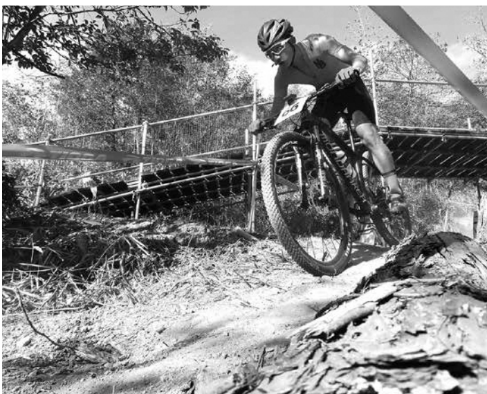
コースを駆け抜ける選手

また、前日には2021年に開催予定の「ワールドマスタースゲームズ2021関西」を記念したシヤパンスーパーマスタースゲームズのレースも開かれ、多くの参加者でにぎわいを見せました。