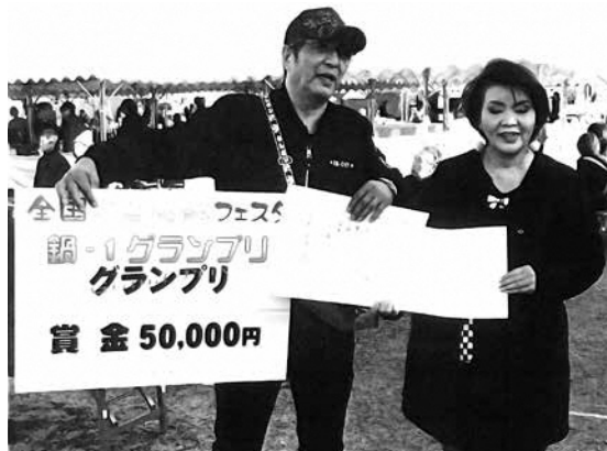
優勝した奈良かつば鍋普及会