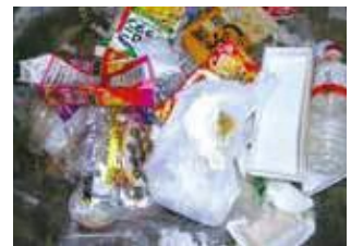
プラスチック容器包装ごみに混ざっていた紙類・ペットボトル類