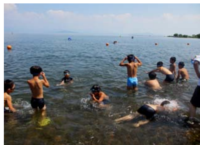
びわ湖での水遊びは最高

八 月 三 日 ( 金 ) 学 習 行 っ た こ の 日 は 小 学 生 二 十 二 人 指 導 員 七 人 ど の 国 へ 出 っ た 午 前 七 時 十 分 午 前 七 時 十 分 和 束 町 役 場 た 午 前 七 時 十 分