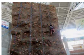
地上9メートルクライミングに挑戦

い に 食 べ ま し た 。 指 導 員 監 視 の 下 と び び 湖 水 遊 び を し ま し た 。 学 習 の 日 休 息 み ち 楽 し っ た で 出 っ た