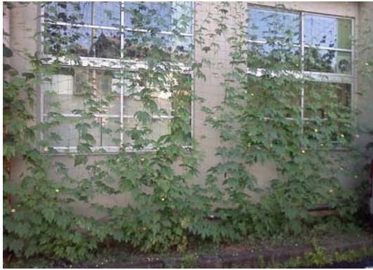
社会福祉センター