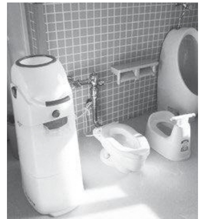
左：トイレに設置されたおむつ処理器

「不衛生なものを持ち帰らなくてもいいので、ありがたいです。月曜と金曜にバケツの持ち運びがなくなったので負担が減りました。」等の声が寄せられました。