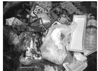
プラスチック容器包装ごみに混ざっていた紙類・ペットボトル類