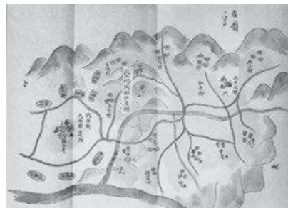
「古図ノ写」

問合せ 相楽東部広域連合教育委員会生涯学習課和束町史編さん室 ☎ 0774・74・8952 HP https://www.union.sourakutoubu.lg.jp （和束町史編さん室）