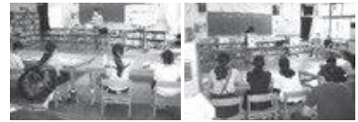
認知症について学ぶ 脳トレーニングの体験

住み慣れた笠置町で、高齢者を温かく見守るキッズサポーターの一員として活躍をしてけると期待しています。