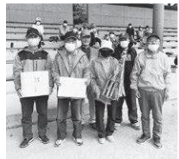
笠置町町長杯GG大会