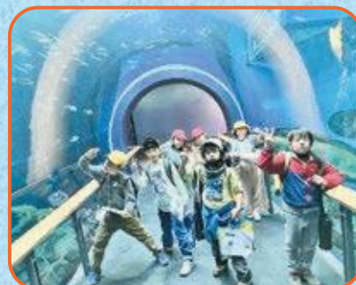
3年生 琵琶湖博物館