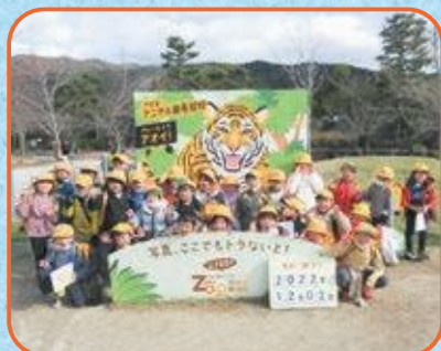
1年生 京都市動物園