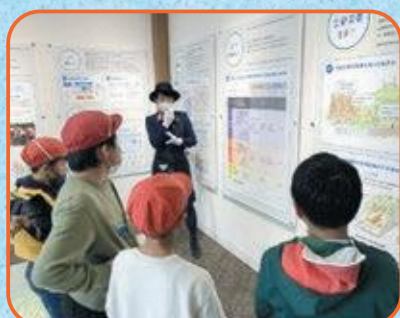
4年生 京都市市民防災センター・文化パルク城陽