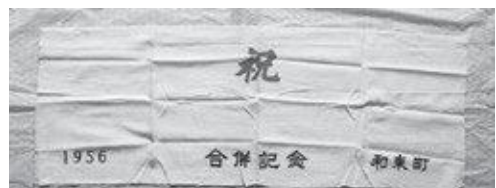
1956年（昭和31年）和束町・湯船村合併記念手ぬぐい

その後、湯船村有林は合併後も湯船財産区有林とすることで話し合いがまとまり、1956年（昭和31年）9月30日湯船村も合併して、現在の和束町が誕生したのです。