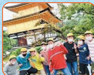
6年生 金閣寺・二条城・佛教大学