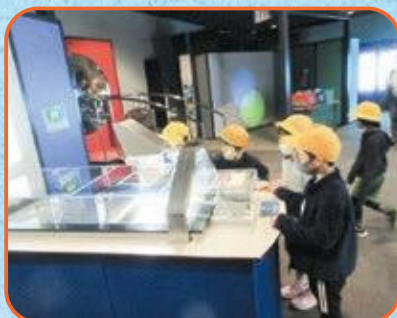
2年生 きつづ科学ふおとん・東大寺大仏殿