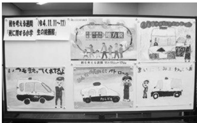
笠置町産業振興会館にて

11月11日(金)～17日(木)までの「税を考える週間」の一環として、笠置町・南山城村の小学校の児童たちが思い思いに描いた絵画作品を展示しました。