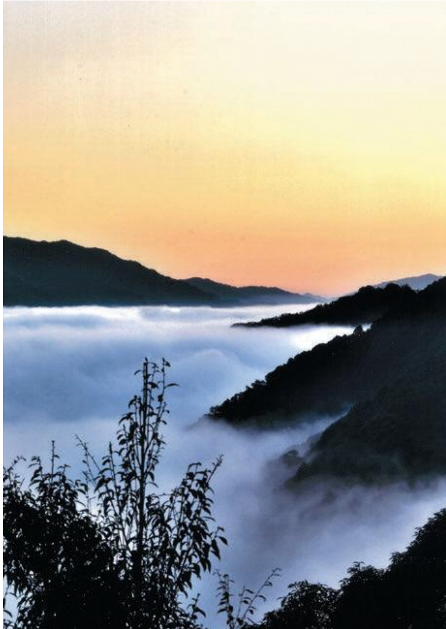
表紙写真：第14回笠置町フォトコンテスト応募作品「-6℃」