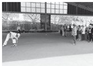
連合教育長杯GB大会