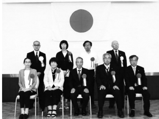
北川委員(前列左から2番目)、森嶋委員(前列中央)