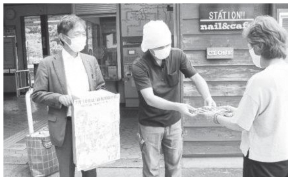
JR笠置駅前での街頭啓発活動