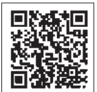
QRコードからもHPにアクセスできます。