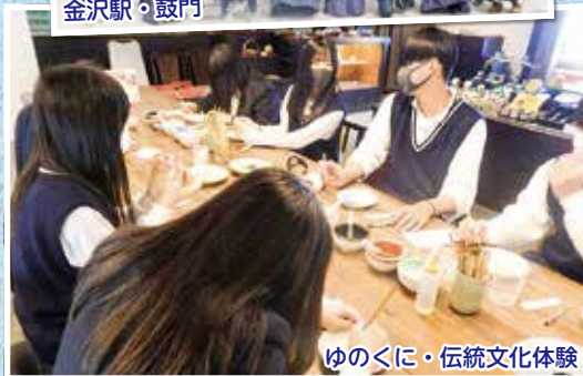
ゆのくに・伝統文化体験