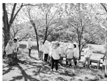
桜の木の下を散策