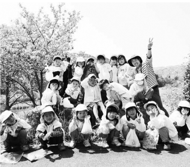
満開の桜の前でみんなでポーズ