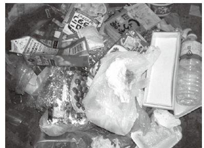
プラスチック容器包装ごみに混ざっていた紙類・ペットボトル類

プラスチック製容器包装ごみを出される際は、容器の汚れを落とす、他のごみを入れない等、分別を守ってください。