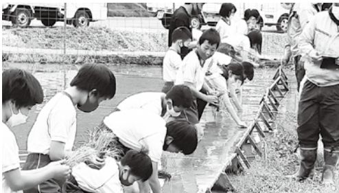
指導のもと、田植え体験中

9月に収穫するお米は、全校児童で味わったり、地域の人にふるまったりする予定です。