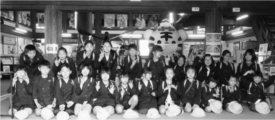
伊賀上野城での集合写真

心配していた雨もなんとか持ち、計画していた内容を全ておこなうことができました。子どもたちのふり返りでは、「お城が大きかった」「忍者屋敷のからくりがすごかった」「や」「なかよし班の友だちと協力したので、仲良くなれた」などの感想を笑顔で発表している姿が印象的でした。どの児童もとても有意義な時間を過ごすことができました。