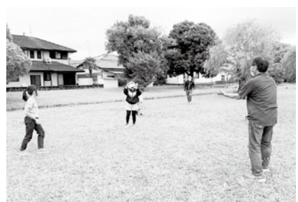
芝生でのボール遊び