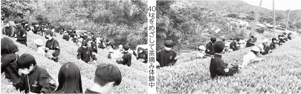
40kgをめざして茶摘み体験中

小中連携の一環として取り組んでいるお茶摘みは、今回の体験をもとに各校のふるさと学習として深め、和束町の主産業であるお茶を中心とした学習で小学校と中学校のつながりをさらに深めていく予定です。