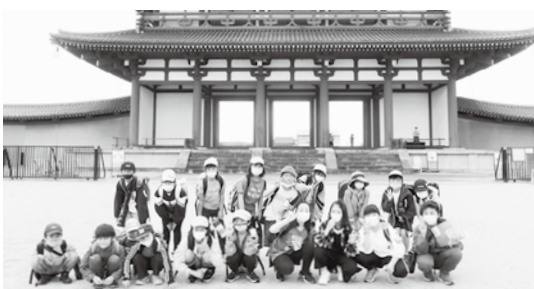
朱雀門での集合写真

生涯学習課では、3町村の子どもたちが積極的に交流できるよう、さまざまな事業を計画しています。ぜひ、親子で参加ください。