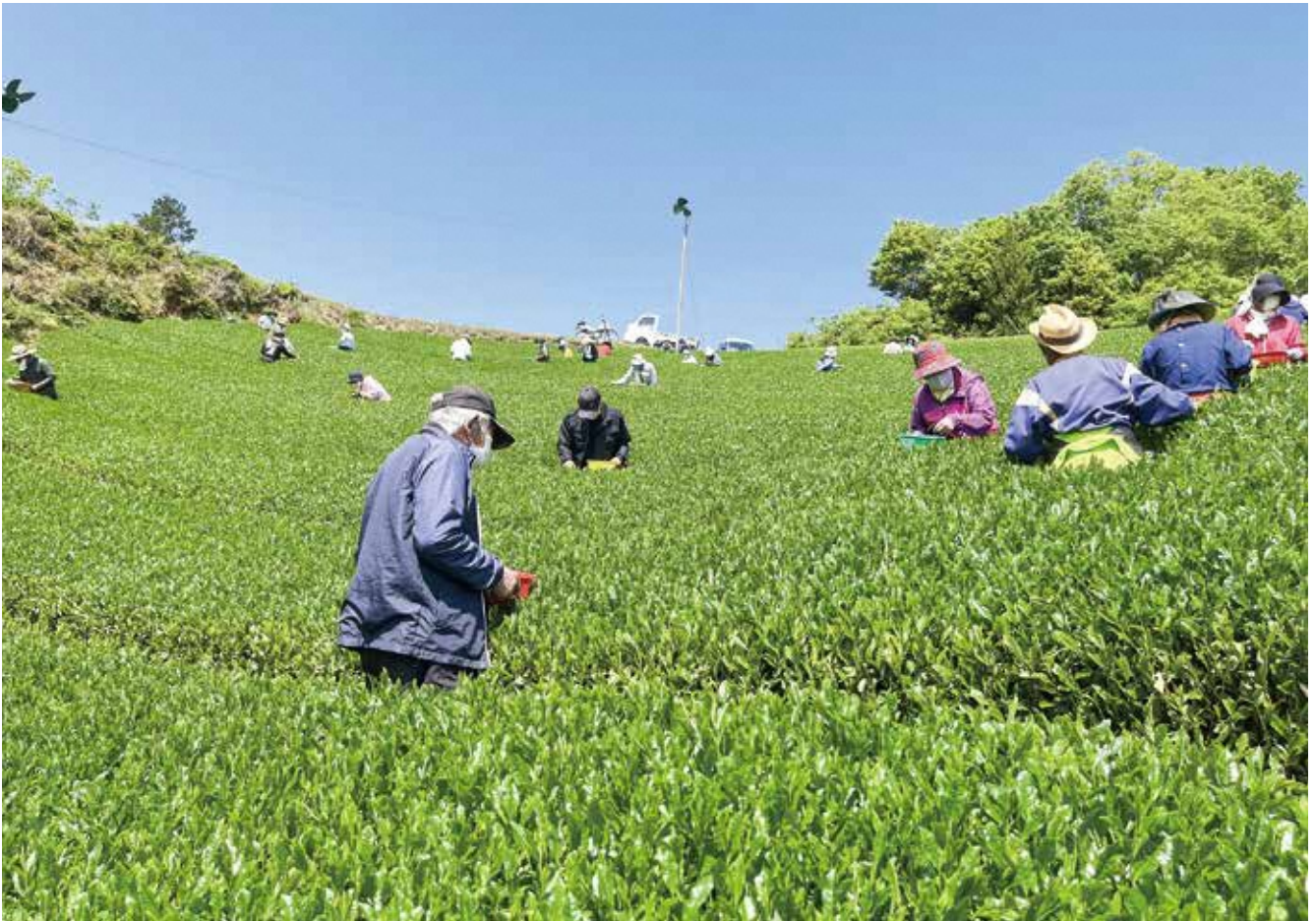
表紙写真：晴天の中でのお茶摘み 南山城村高尾中谷茶園