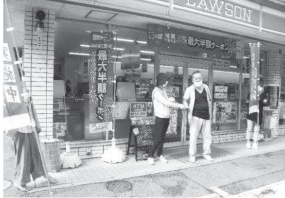
ローソン笠置切山店での街頭啓発活動