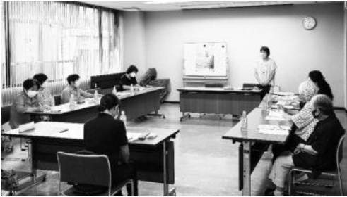
更生保護女性会ミニ集会