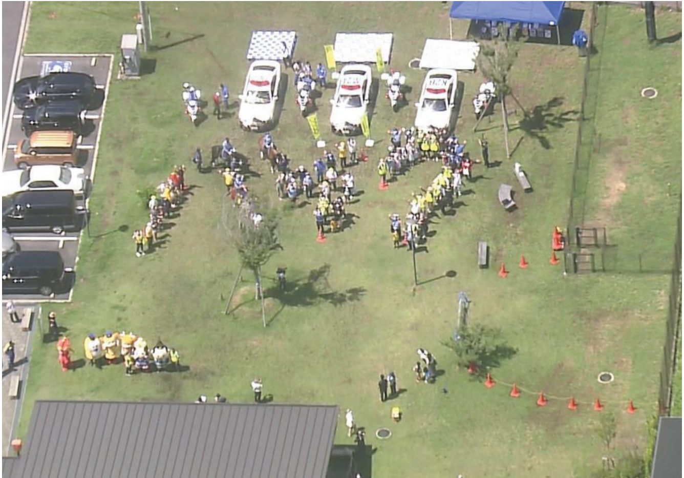
表紙写真：奈良県奈良警察署・三重県伊賀警察署・京都府木津警察署合同「バイクの日（8月19日）」交通事故防止啓発活動 （道の駅 お茶の京都 みなみやましろ村にて）