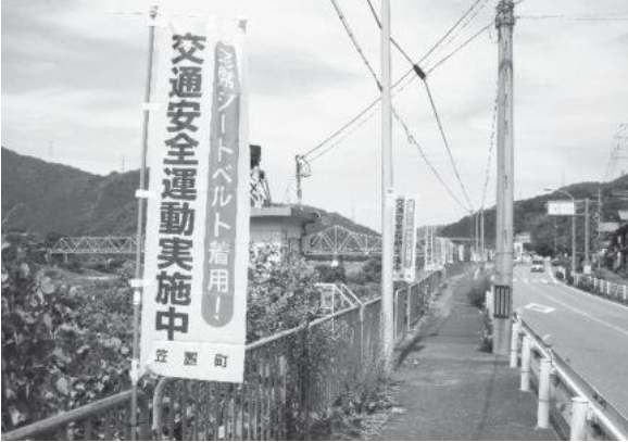
交通安全のぼり旗の掲出(国道163号)

7月22日(金)、JR笠置駅前とローソン笠置切山店にて夏の交通事故防止府民運動に伴う街頭啓発をおこないました。当日は、笠置町交通安全対策協議委員会とともに声かけ運動と啓発物品の配布により、多くのみなさんに交通安全思想の普及・浸透が図られ、道路交通環境の改善に向けた啓発ができました。 また、21日(木)から29日(金)までは国道163号にて交通安全のぼり旗も掲出し、多くの運転手へ注意喚起を図りました。 笠置町では、引き続き交通事故のない安心・安全なまちづくりをめざしていきます。