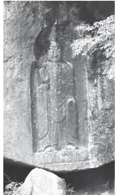
弥勒磨崖仏(相楽東部広域連合指定文化財)

HP https://www.union.sourakutoubu.lg.jp (和束町史編さん室)