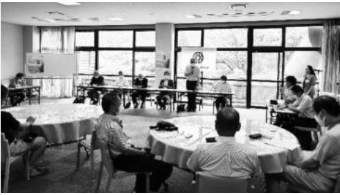
笠置町推進委員会

また、7月14日（木）には、笠置町産業振興会館において、更生保護女性会ミニ集会が開かれました。地域と行政の連携、住民の声にどのように寄り添っていくのか等意見交換をおこないました。