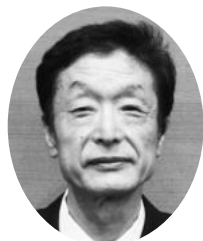
井上 武津男 議員 (和束町)

ICTなど社会の変化に対応しつつ、未来を担う子どもたちにも、「生きる力」の基礎を身に付けてもらいたい。