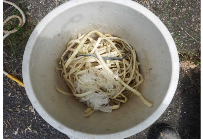
下水道に流れてきた製茶機械の洗浄用具(左)とビニールひも(右)