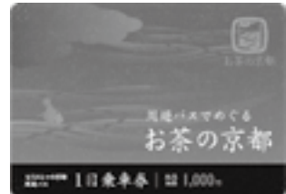
もうひとつの京都周遊パス