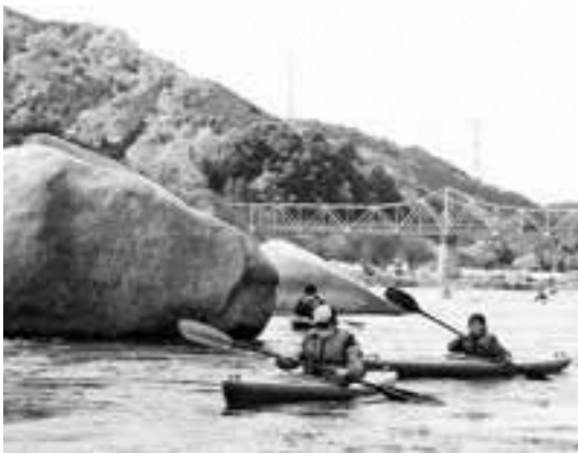
木津川カヌースクール（笠置町）