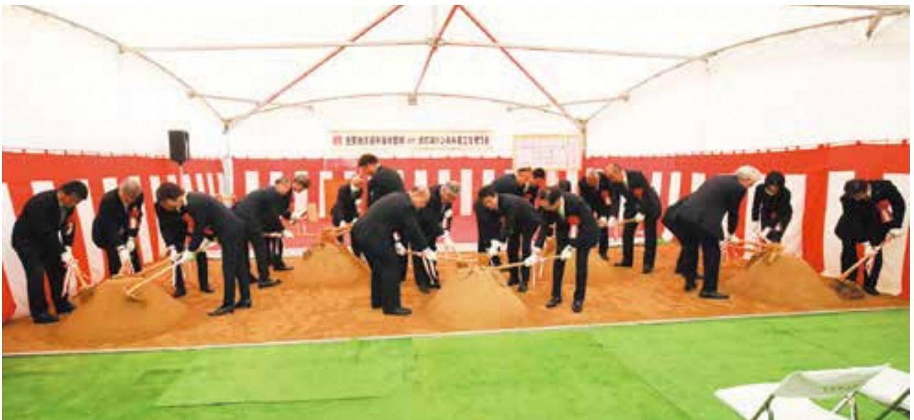
表紙写真：(仮称)犬打峠トンネル いよいよ和束町側も着工