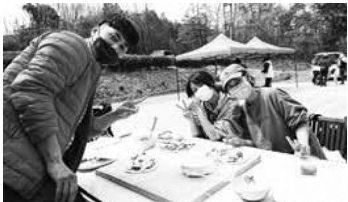
自然を感じる健康ウォーキングとピザ作り体験（南山城村）