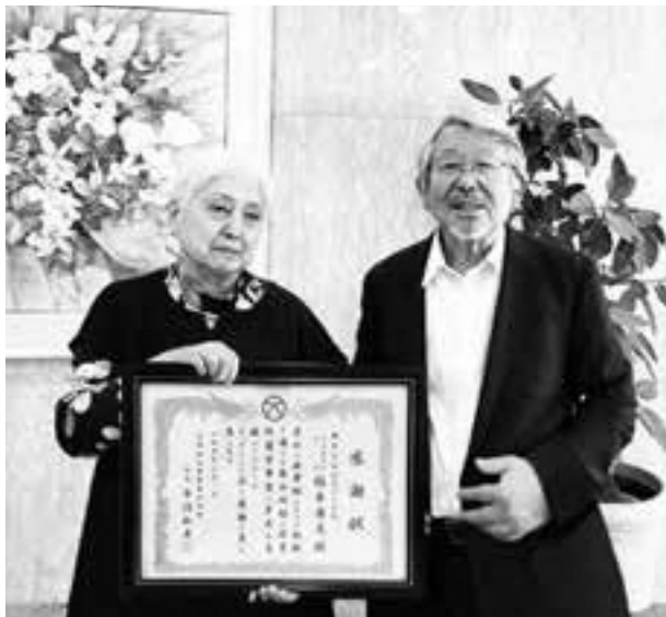
(左から植木代表取締役、植木代表取締役会長)