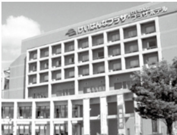
けいはんなプラザホテル