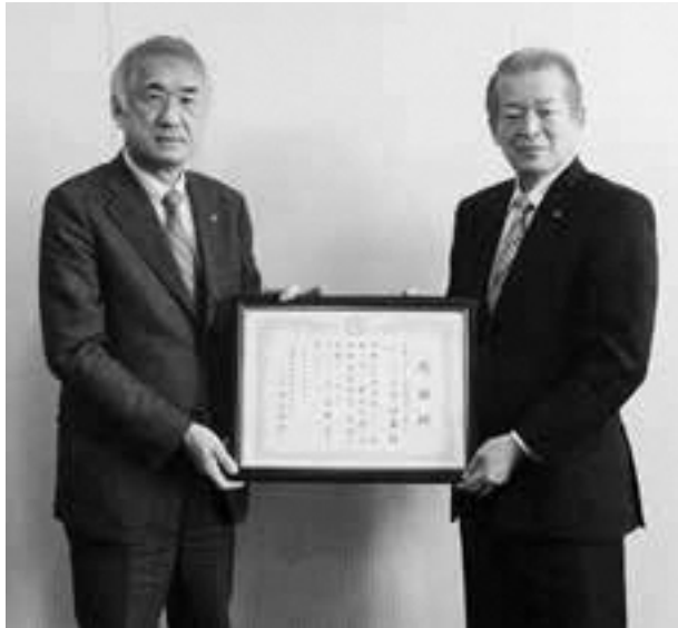
(左から平沼村長、十川代表理事組合長)