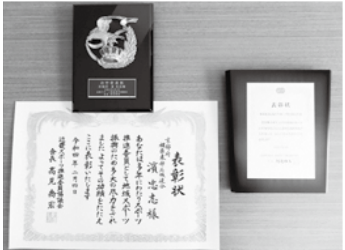
左：近畿スポーツ推進委員協議会表彰（個人） 右：全国スポーツ推進委員連合優良団体表彰（団体）