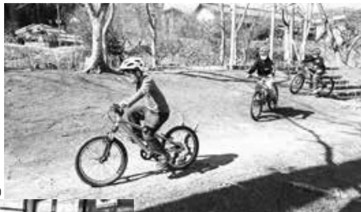
マウンテンバイク& ハーブ体験（和束町）