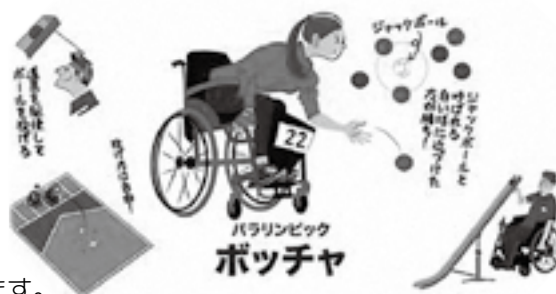
ボッチャイメージ