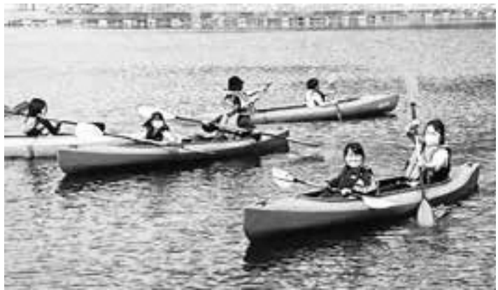
高山ダム湖カヌー巡り探検ツアー（南山城村）