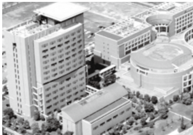
けいはんなプラザ

その中心エリアに位置する交流施設「けいはんなプラザ」は、スタートアップ向けのレンタルオフィス、千人収容のホール、会議場、ホテル、レストラン等を備え、コンサートやイベントのほか、食事を楽しむことができ、ご家族でくつろいでいただけます。