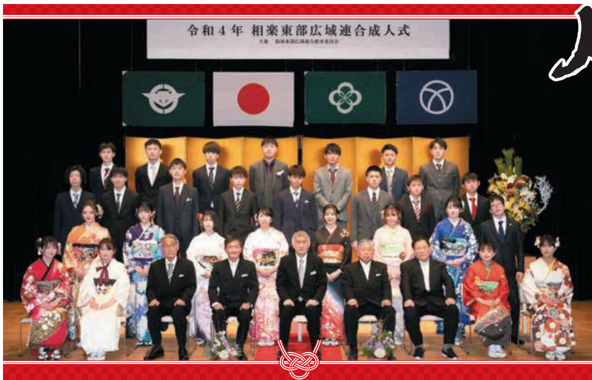
笠置中学校区の新成人（笠置町・南山城村）

今後、新成人のみなさんが、そ れぞれの場所でご活躍されますこ とを心より祈念します。