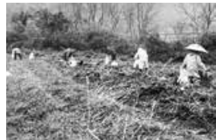
第4回の活動写真から