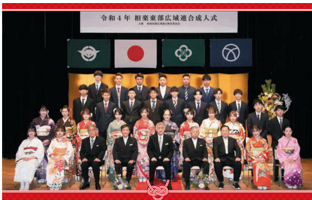
和束中学校区の新成人（和束町）