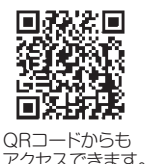
QRコードからもアクセスできます。