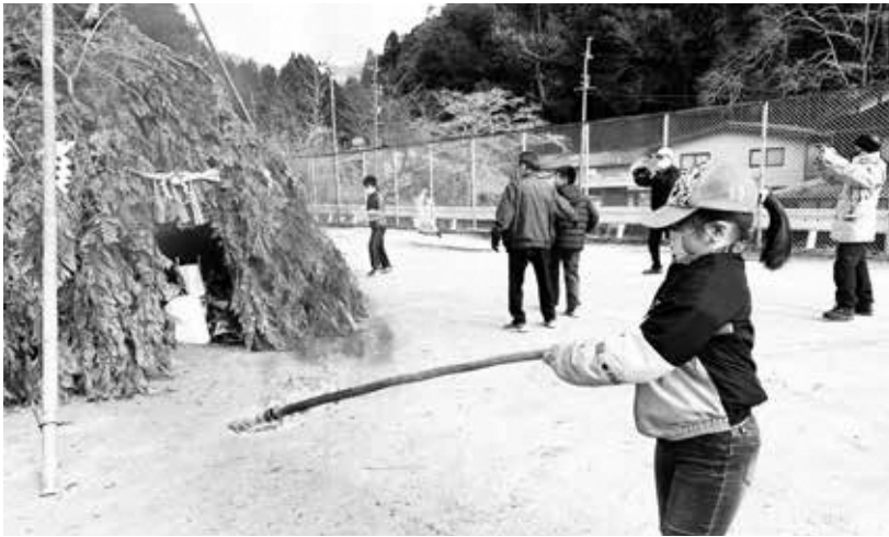
西部ふれあい広場（笠置町）

笠置町で1月16日（日）、西部ふれあい広場（西部区集会場の広場）で、とんどまつりがおこなわれました。 とんどは1年の無病息災を願うての行事で30年以上前から続いています。 地元のみなさんのご協力により、木や竹などで大きな左義長が組み立てられ、児童館の子どもたちが、緊張した面持ちで点火しました。燃え上がる火の中でお餅を焼き、老若男女問わず交流が見られました。