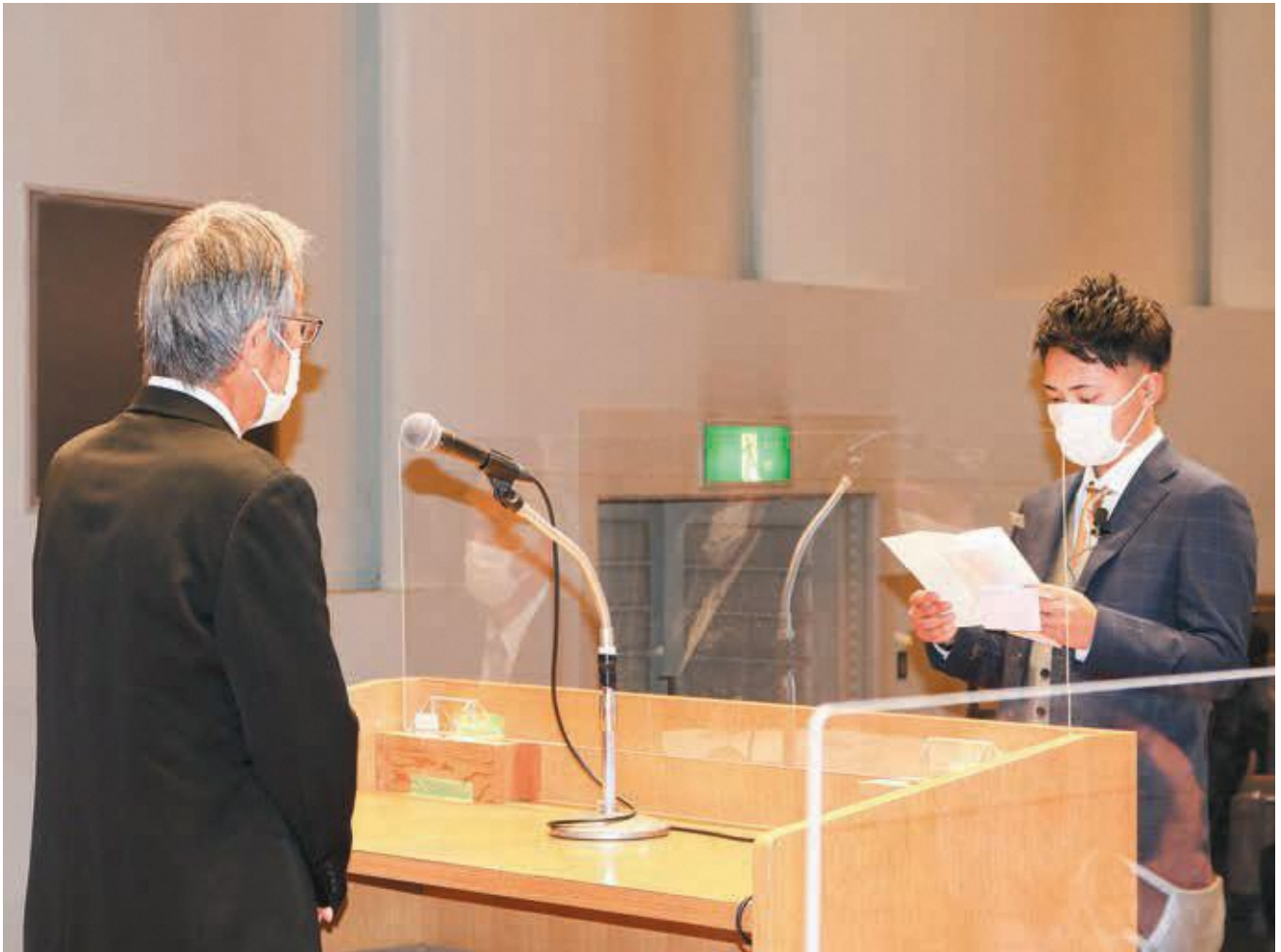
表紙写真：令和4年相楽東部広域連合成人式