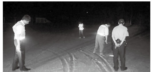
笠置町青少年育成委員会夜間パトロール

また、笠置町では育成委員会の委員が各班にわかれ、7月24日（金）から夜間パトロールを始めました。期間中にコンビニエンスストアやJR笠置駅など、町内の施設を回りながら子どもたちへの声かけなどを行うほか、8月1日（土）に開催される笠置夏まつりにおいて啓発活動も実施します。