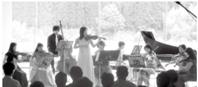
やまなみコンサート Vol.1 より

***** コントラバスセミナー in 南山城村2015参加者によるコンサート *****