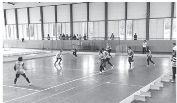
インドアホッケー大会の様子