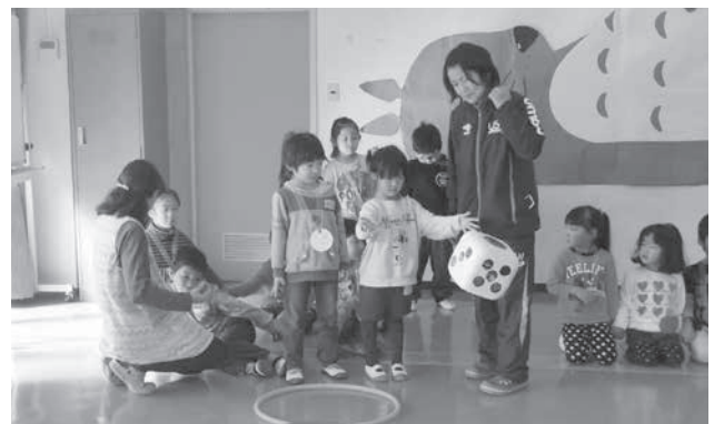
すごろく遊びの様子