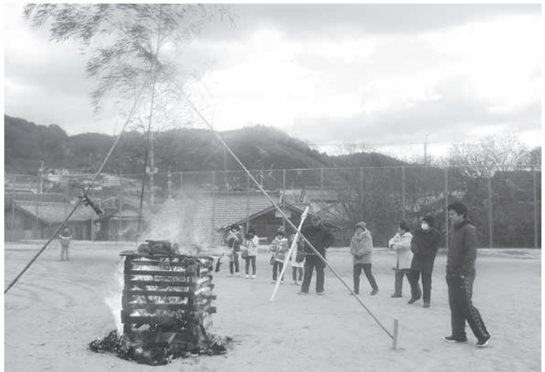
和束町児童公園のとんど焼き