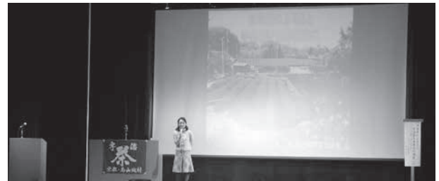
昨年の様子(第38回大会)