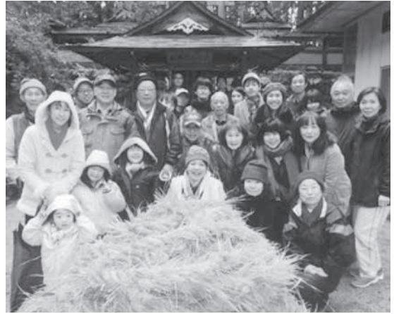
あまてらすみかどじんじや 天照御門神社で勧請縄づくり