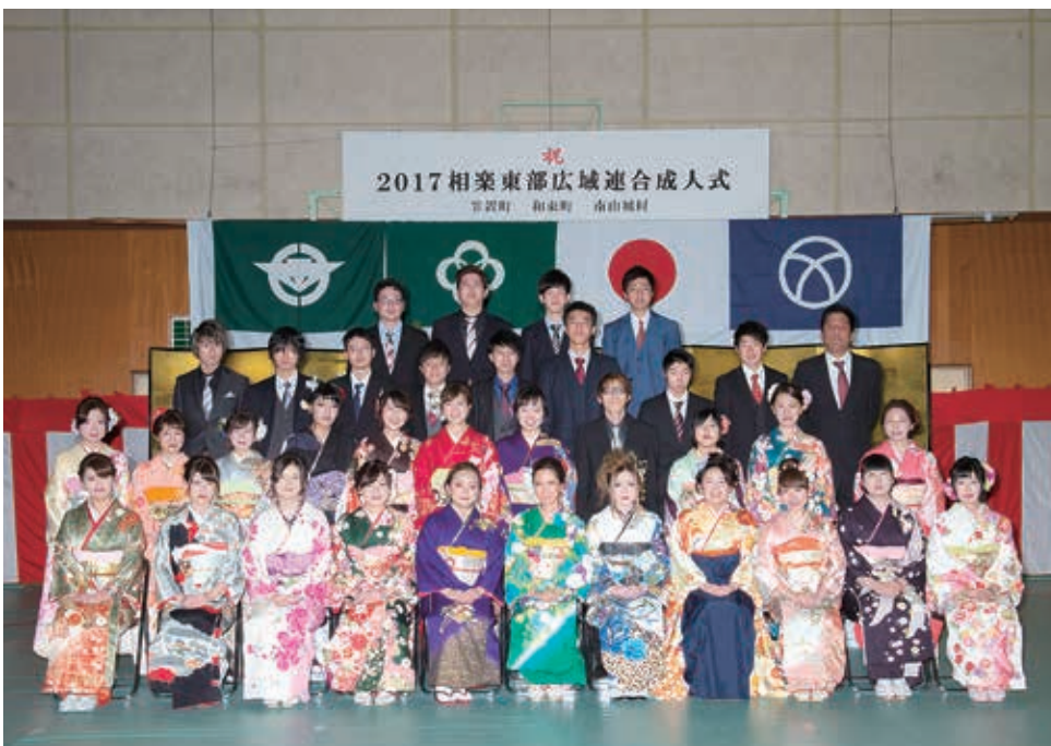
笠置中学校区の新成人（笠置町・南山城村）

新成人のみなさんが、今後それぞれの場所でご活躍されることを心より祈念いたします。