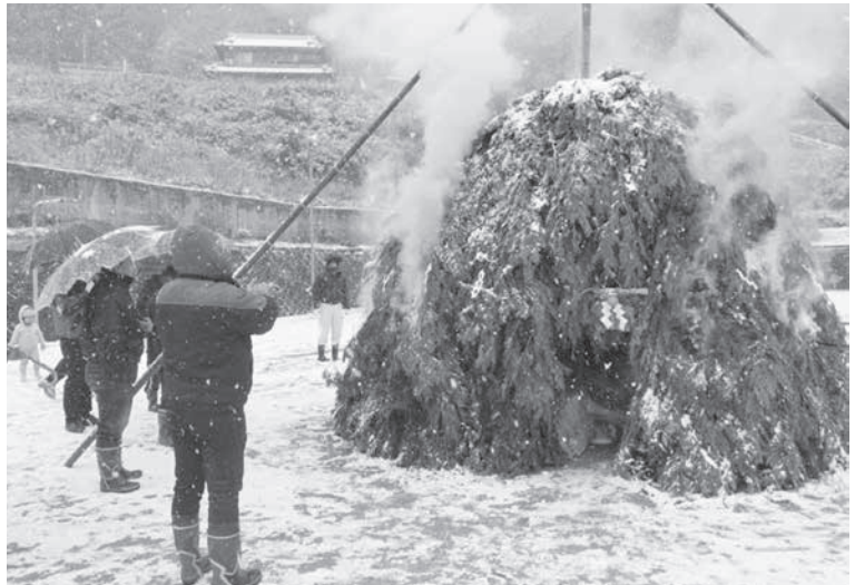
笠置町西部ふれあい広場のとんどまつり

その炭で焼いた餅のぜんざいをいただき、集まった幼児や保護者・児童のみなさんで一年の無病息災をお祈りしました。