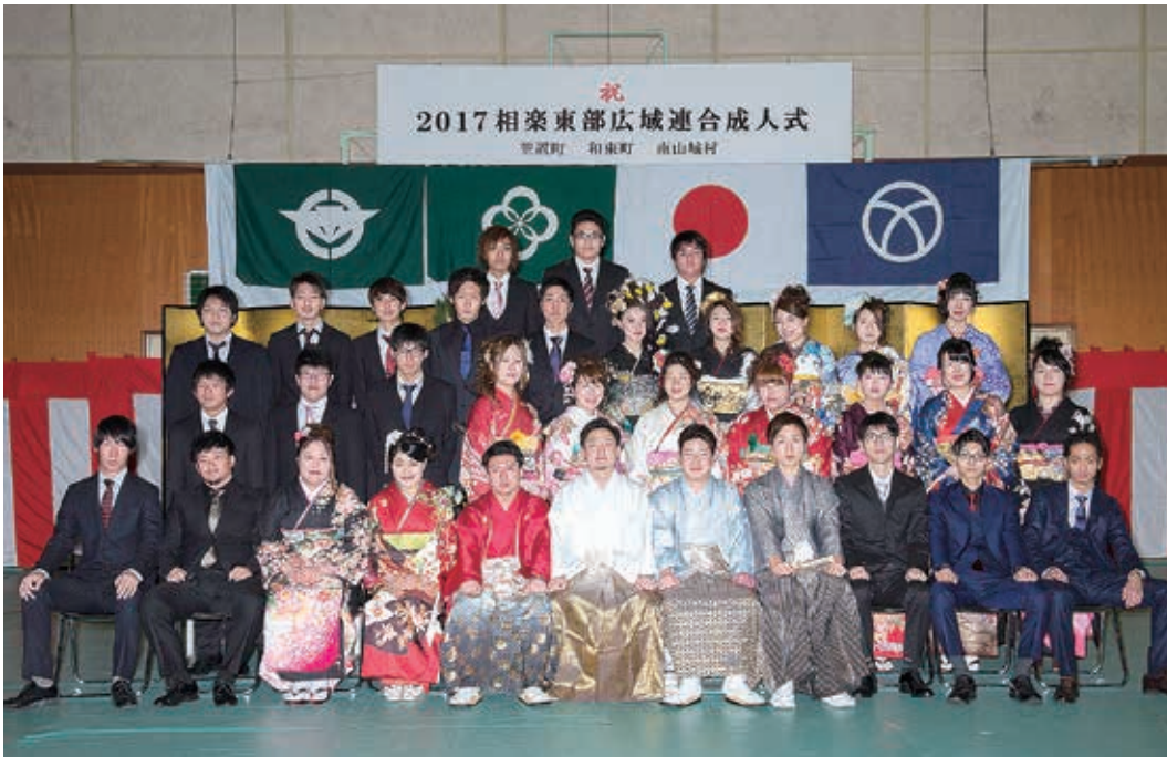
和束中学校区の新成人（和束町）