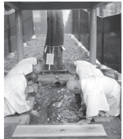
浅間の井戸で行をおこなう様子