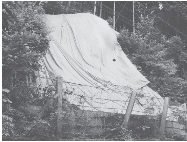
府道上野南山城線

《傘をさしていてもぬれる。》 一時間に二十〜三十ミリです。小川が氾濫し、がけ崩れの危険があります。 《バケツをひっくり返したよりに降る。》