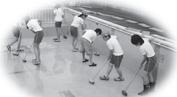
プール清掃の様子

六月十八日(月)、管内小学校の先頭を切って、和東小学校でプール開きがありました。梅雨真っ只中ということもあって、晴天とはなりませんでしたが、子どもたちが待ちに待った水泳学習が行われました。和東小学校に続いて南山城小学校、笠置小学校ともプール開きとなり、児童たちは歓声と水しぶきを上げ、初泳ぎを楽しんでいました。