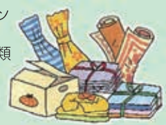
●カーペットやふとんなどは小さくたたみ、 しばって出してください。