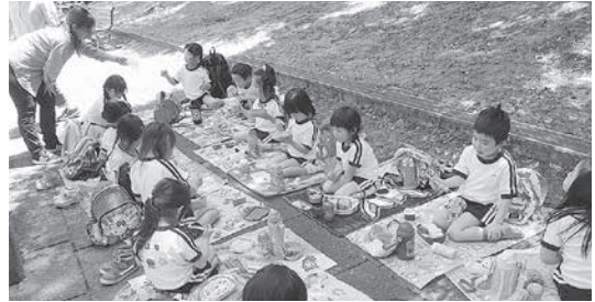
宇治市植物園内 花と水のタペストリー前にて