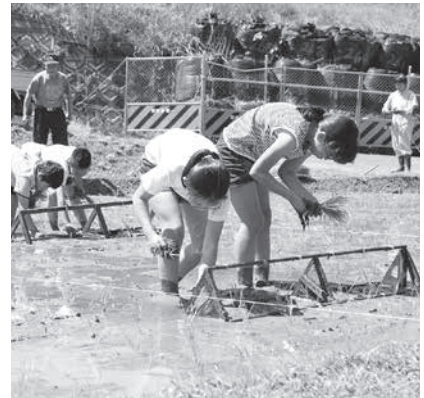
地域の方に教わりながら田植えをする小学生たち