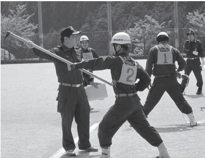
訓練に励む団員たち

4月24日(日)に笠置町消防団教養訓練が笠置町運動公園でおこなわれました。本団役員の指導のもと、礼式訓練や操法訓練がおこなわれました。今年6月19日(日)に笠置町消防団操法大会が開かれるため、操法技術を習得しようとする訓練に参加した団員は皆、真剣な様子で指導を受けていました。これから操法大会本番に向け、日々訓練がおこなわれます。健闘をお祈りします。