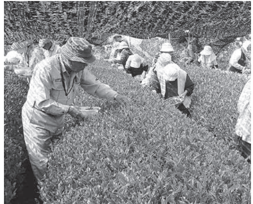
たくさんの方々に摘採のご協力をいただきました

本年度の出品茶の摘採にあたりご協力をいただきましたみなさんに、厚くお礼申し上げますとともに、各種品評会での成績に大きな期待が寄せられます。