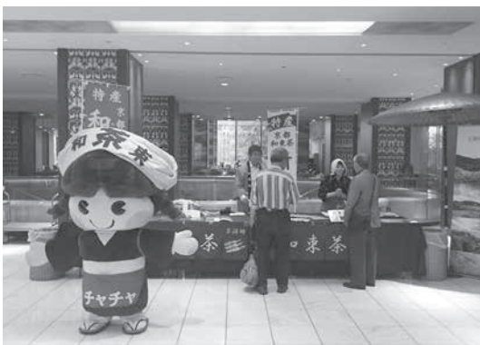
リーガロイヤルホテル大阪での様子

5月2日(月)～5日(木)、リーガロイヤルホテル大阪で、5月3日(火)～5日(木)、リーガロイヤルホテル東京で和束町職員と関係機関が和束茶の新茶を振る舞いました。