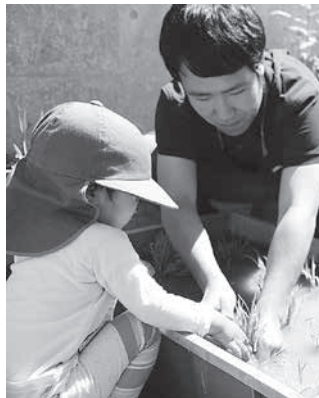
保育士と一緒に苗を植える園児

園児も、小学生もこういった昔ながらの体験をする中で、稲のように大きくたくましく成長していくことでしょう。