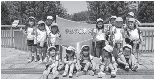
宇治市植物園で記念撮影

3町村各保育園(所)では、この春、遠足に出かけました。 笠置保育所では5月13日(金)、宇治市植物園へ遠足にいきました。当日は天気にも恵まれ、今年初めての遠足に3～5歳児の14名は、元気いっぱいに活動できました。宇治市植物園のきれいな花々や見たことのない植物を見たり、匂ってみたりと興味津々でした。「うみうのウッティー」を壮大な雑壇にプランターを並べて描かれた「花と水のタペストリー」で美味しいお弁当を食べました。 和束保育園では5月20日(金)、全園児が和束町内で遠足をしました。 乳児クラスは園周辺へ、3歳児はロータリー公園へ出かけ遊んだり、おやつを食べたりして楽しみ、4・5歳児は児童公園へ出かけ子ども館でお弁当を食べました。 当日は夏を思わせる日差しの中でしたが、子ども達は、お家の方に作ってもらったお弁当を楽しみに遠足の日を過ごしました。 南山城保育園では5月2日(月)、園児たちが南山城村内で遠足をしました。 大河原小橋からやまなみホールまで木津川沿いを散策し、シロツメクサや四葉のクローバーを探してみたり、摘んだりして四季の変化を感じる遠足となりました。