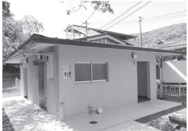
JR 笠置駅の新しいトイレ

JR 笠置駅は笠置町で唯一の公共交通機関です。安全性・利便性を高めることを目的に、「平成 26 年度 地域活性化・地域住民生活等緊急支援交付金実施計画」により、JR 笠置駅の汲み取り式トイレを改修しました。住民の方や観光客の方の小さな拠点の一つとして、トイレを洋式化し多目的トイレを導入するなど、より快適にお過ごしいただけるようになっています。