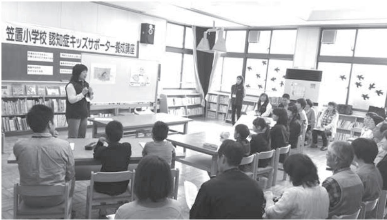
認知症への理解を深める児童

笠置町地域包括支援センターは、5月10日（火）笠置小学校で認知症キッズサポーター講座を開きました。5年生、6年生と民生児童委員の方が認知症について学びました。 児童からは「これから高齢者には優しい声掛けで接したい」という声が出ました。