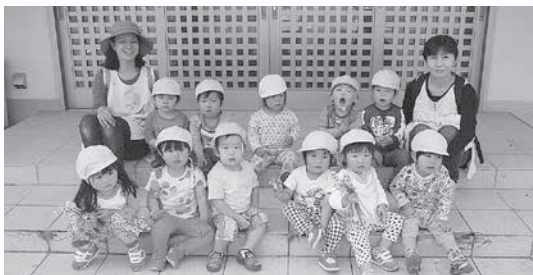
和束町中区公民館で記念撮影