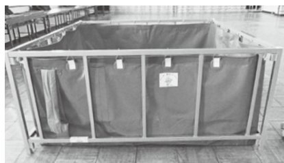
消火栓ホース33本、角型組立水槽1台