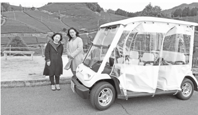
「石寺の茶畑」を前に周遊を楽しむ観光客