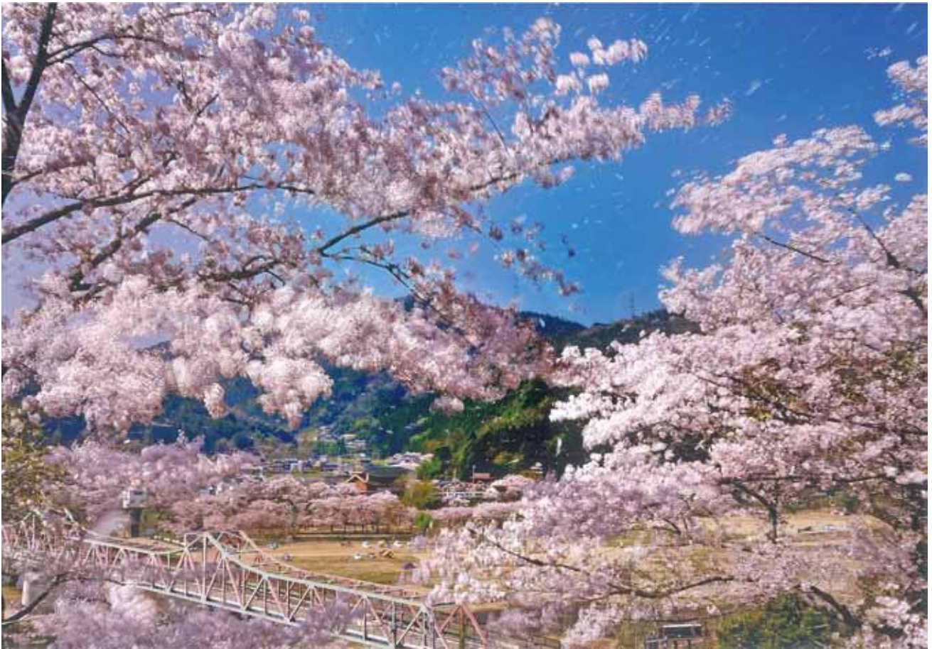
表紙写真：笠置町フォトコンテスト最優秀賞 『散り初め』