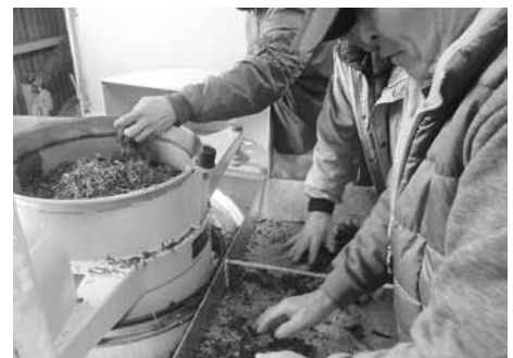
製茶過程でお茶の状態をチェックする研究会のみなさん