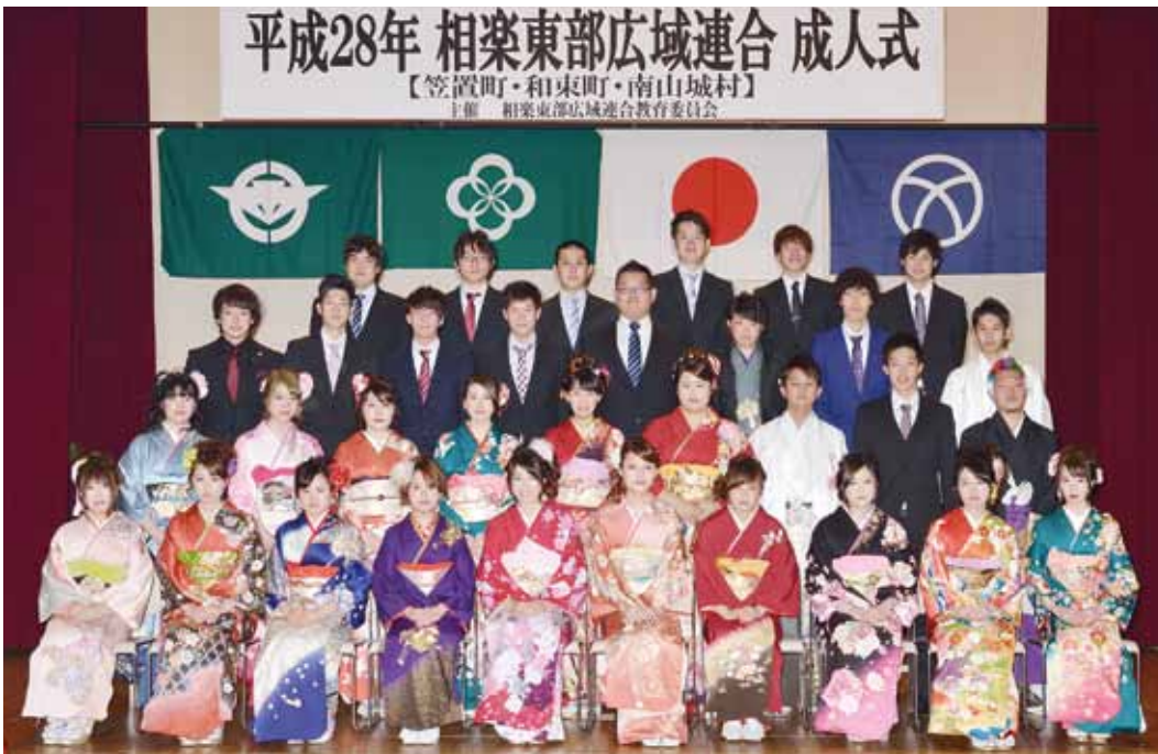
笠置中学校区の新成人（笠置町・南山城村）