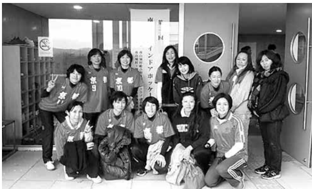
女子の部 南山城村チーム

12月23日（水・祝）に南山城小学校で、南山城村総合型地域スポーツクラブ設立準備委員会主催による、「南山城村インドアホッケー大会」が開かれました。