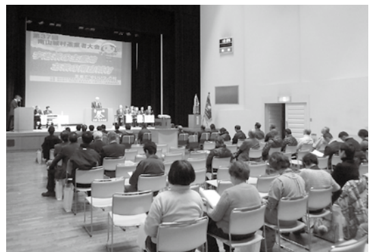
昨年の様子(第37回大会)

日時 2月25日(木) 午後1時～ 場所 南山城村文化会館「やまなみホール」 大会内容 (1) 褒章授与及び感謝状贈呈式 (2) 講演 (3) 茶香服大会 など