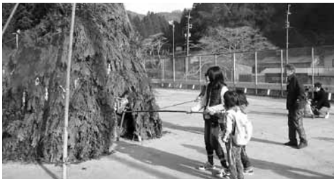
笠置町 西部ふれあい広場のとんどまつり