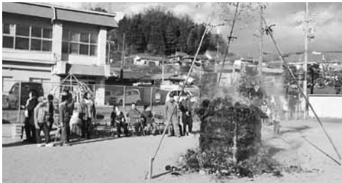
和束町児童公園のとんど焼き