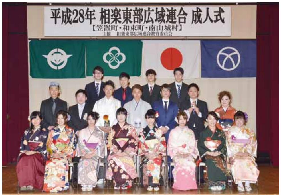
和束中学校区の新成人（和束町）