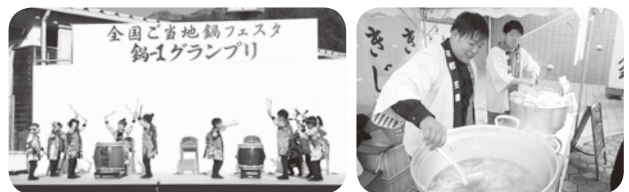
昨年の鍋-1グランプリの様子

また、鍋だけでなく、ご当地グルメの出店や、第10回の記念イベントも予定しています。ぜひご来場いただき、全国の「食」をご堪能ください。