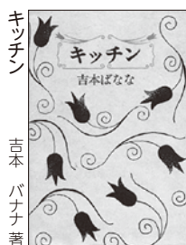
キッチン 吉本バナナ 著