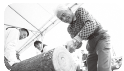
昨年より復活した丸太切りレース

人気よしもとお笑い芸人も登場!! 食べて、見て、買って、体験して、南山城村の魅力を全身で感じてください。