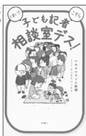
子ども記者相談室デス! 大島真寿美 著