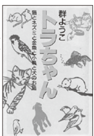
トラちゃん 群たつこ 著