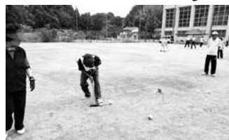
ゲートボール大会(南山城村第2グラウンド)