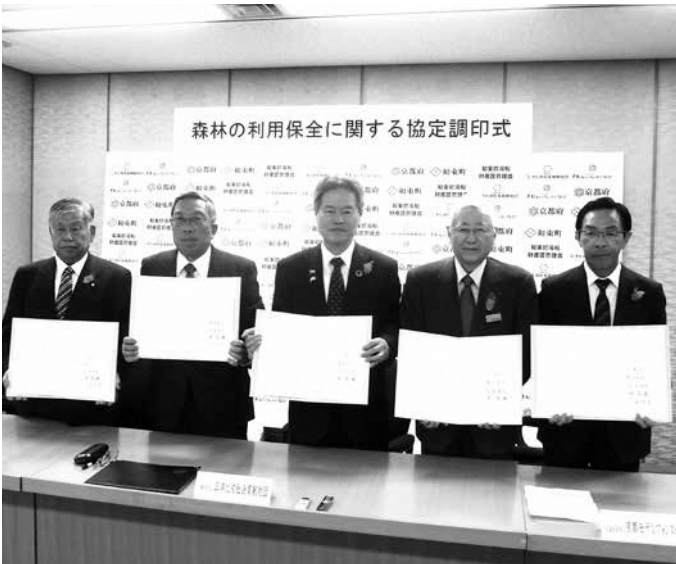
モデルフォレスト調印式

一般財団法人三洋化成社会貢献財団との本協定に、京都府・京都モデルフォレスト協会・和束町湯船財産区管理会・和束町が協定書に署名し、相互に協力して森林保全に取り組むことを定めました。