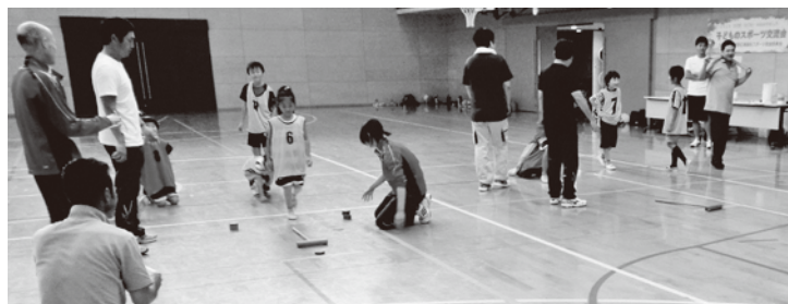
マイバックの様子

9月28日(土)、笠置小学校・和束小学校・南山城小学校でそれぞれ運動会が開かれました。雨が心配されていましたが天気にも恵まれ、子どもたちはこの日のために練習してきた成果を、家族や地域のみなさんに見てもらおうと演技に競技に一生懸命取り組んでいました。子どもたちのひたむきな姿は、見ている人に大きな感動を与え、大きな拍手や歓声がわき上がっていました。