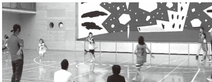
ドッジビーの様子