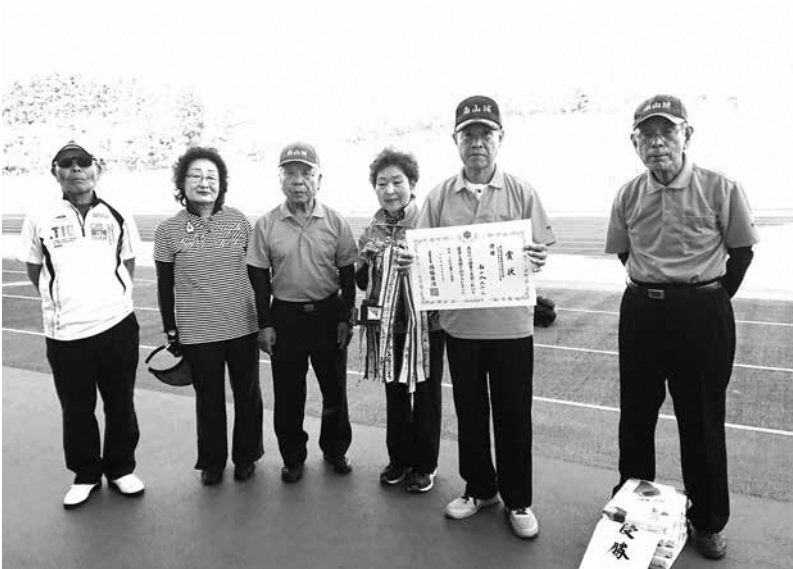
優勝されたチームのみなさん

また、ゲートボールに興味のある方は随時会員を募集しておりますので、教育委員会南山城村分室(☎0743・93・0580)までお問合せください。