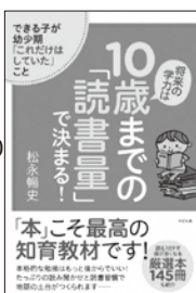
10歳までの読書量で決まる! 松永暢史 著