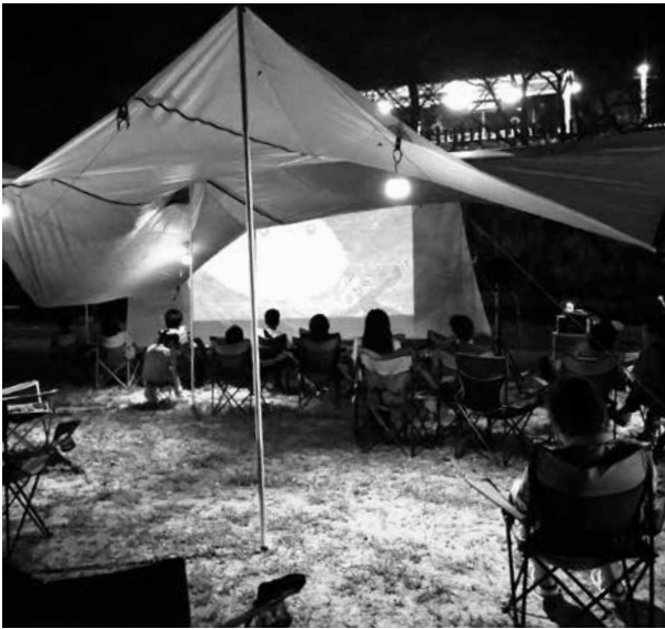
クリエイターズキャンプの様子

今回参加したみなさんの中には初めて笠置に来た方もいらつしやいましたが、今回の参加を機に、笠置町を知ってもらえる機会となりました。