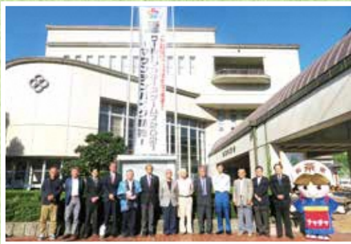
茶茶ちゃんも登場した委員のみなさんの集合写真

2021年の開催に向けて、町民みなさんの総力を結集して成功に向けて取り組んでまいりたいと思いますので、みなさんご協力をよろしくお願いいたします。