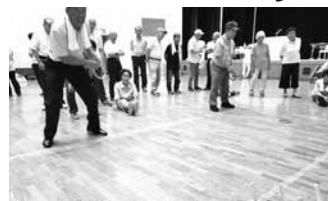
ワナゲ大会(やまなみホール)