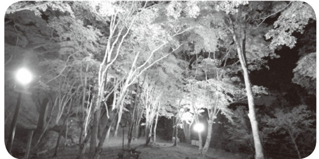
昨年のライトアップ

⚠️お願い! 本イベントは事前チケット購入制による有料イベントです。既にチケットは完売しており、チケットをご購入された方のみが特設会場にご入りいただけます。なお、笠置寺拝観料をお納めいただければもみじ公園周辺にはお入りいただけますのでご自由にお越しください。コンサートの音色だけはお楽しみいただけます。