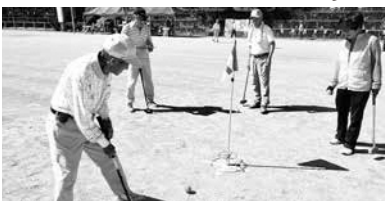
グラウンドゴルフ大会(南山城村総合グラウンド)