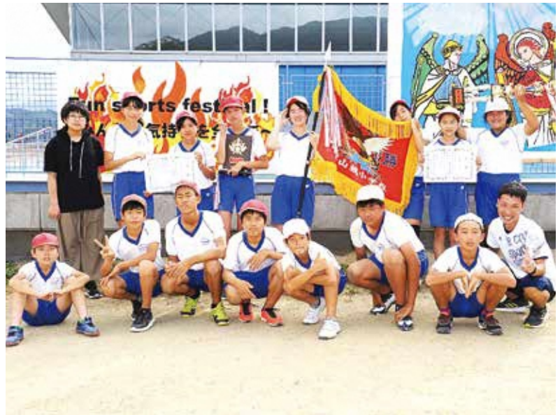
表紙写真：笠置小学校(上)・和束小学校(下左)・南山城小学校(下右) 運動会 (※記事等詳細は7ページをご覧ください)