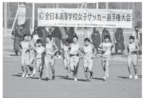
全国大会出場チームのメンバーと