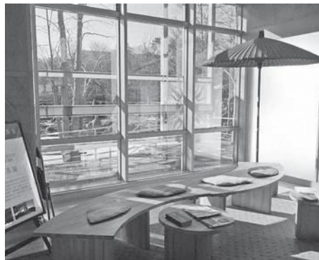
一坪茶室 三煎茶屋

来場者は道の駅の「抹茶ぜんざい」で温まりながら、落葉した冬景色の庭園や生け花等を楽しまれました。