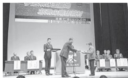
昨年の様子(第40回大会)