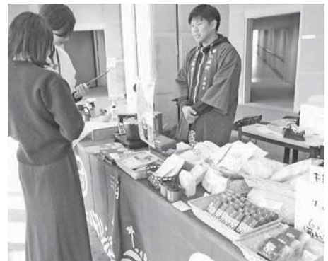
道の駅 お茶の京都みなみやましろ村が出店