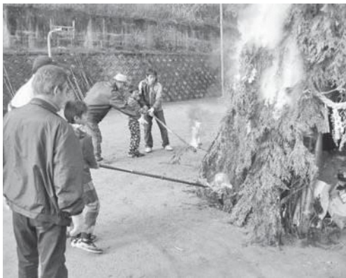
西部ふれあい広場

子どもたちが点火すると火は一気に燃え上がりました。その炭で焼いた餅のぜんざいをいただき、集まった住民の方、保護者や幼児、児童みんなで一年の無病息災をお祈りしました。