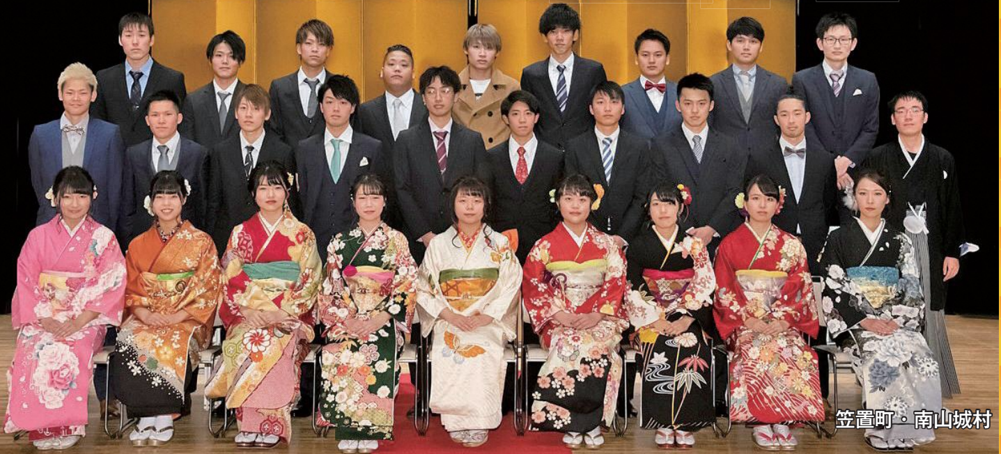
笠置町・南山城村