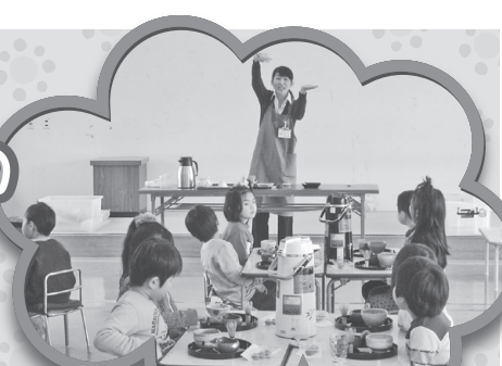
今日はおいしい お茶をのみましょう