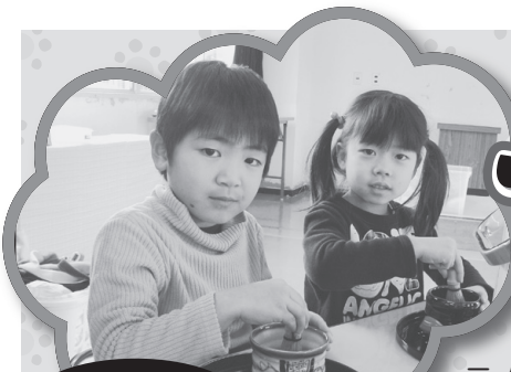
茶筌は このようにもって