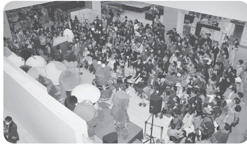
ゆるキャラは、子どもたちに大人気