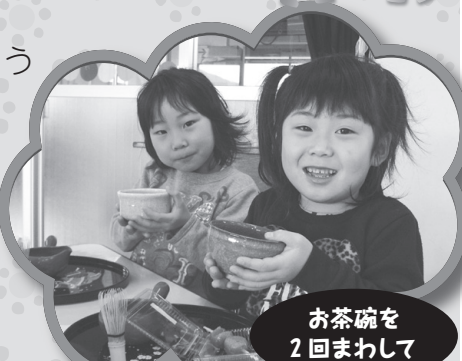
お茶碗を 2回まわして