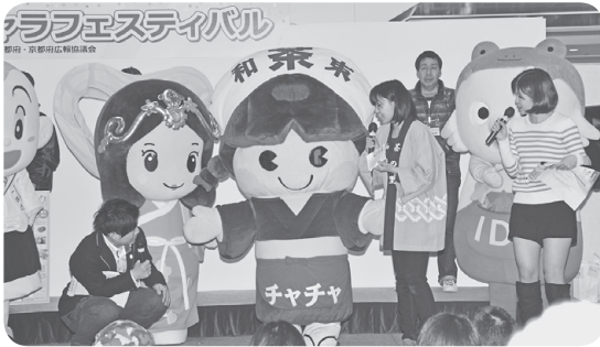
和東町の魅力や特産品をアピール

二月一七日(日)京都駅八条口前にあるイオンモールKYOTOで京都ご当地キャラフェスティバルが開かれ、和東町のマスコットキャラクター「茶茶ちゃん」が参加しました。