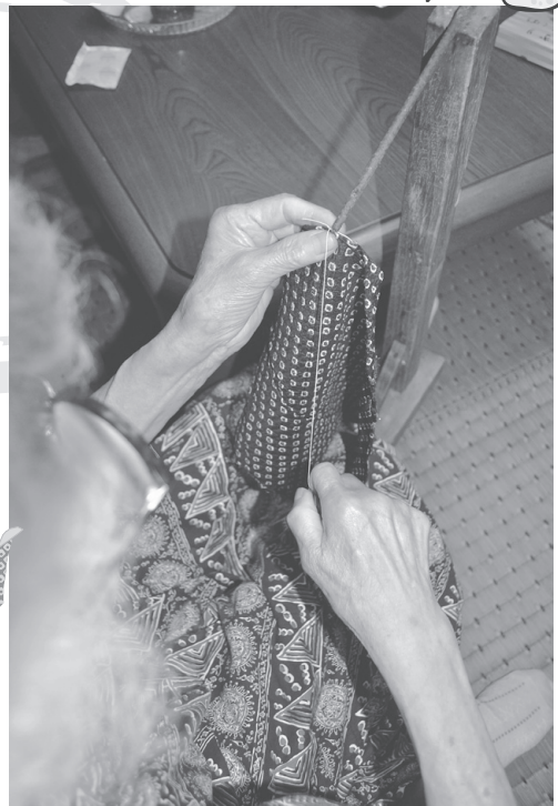
昔なつかしい鹿の子絞り台