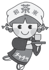
和東町マスコットキャラクター

和東町から参加した茶茶ちゃんは、特産品である煎茶をもっと多くの人に飲んでもらおうとお茶のPRや、イベントの紹介をしました。また、茶茶ちゃんはステージイベントの合間に地元の特産品PRコーナーへも顔を見せ、記念撮影や握手に頑張っていました。