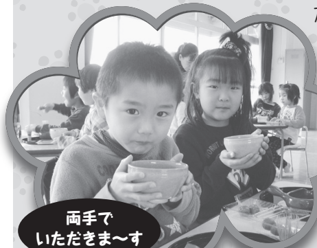
両手で いただきま〜す