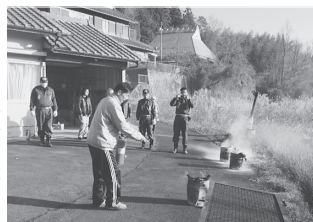
▶約30名が参加しました