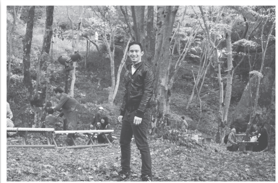
もみじまつりに行きました！

この村での2年間の生活は本当に早く過ぎました。生まれも、育ちもずっと都会で、田舎に来た後、新しい経験と挑戦でいっぱいでした。車もなくて、知り合いもあまりいないので寂しい時がありました。徐々にイベントに行くようになり、新しい人と出会って、私がこのコミュニティのメンバーだと感じるようになりました。南山城村が私の故郷と感じるようになったので、離れるのは悲しいです。