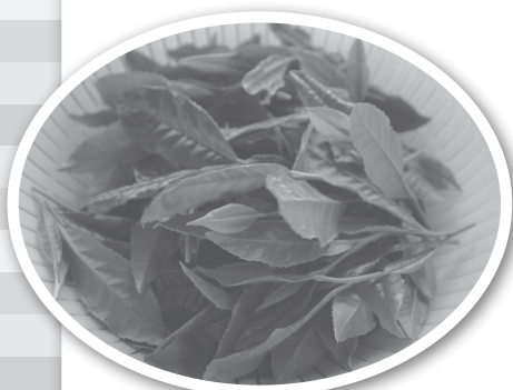
お茶摘み体験しました！

Some of my favorite memories are Kasagi's Momiji Matsuri, Wazuka's Teatopia Festival, and Tayama's Hana Odori. I have grown to love being surrounded by nature and seeing the change between seasons. I have gotten to plant rice, pick tea leaves, and harvest shiitake. What I will treasure most is my time teaching the students here. I hope that I have been able to make students enjoy learning English and become more interested in other countries. I would like to thank everyone in the Souraku district for being so welcoming towards me. I'm not sure where I will end up after this job, but I hope to visit Minami Yamashiro Village again someday in the future.