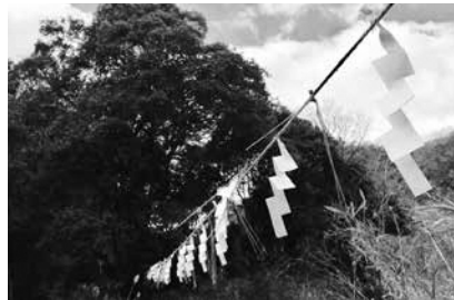
新たな勧請縄が布目川に架かりました

勧請縄は人手不足のため伝統継承が危ぶまれていましたが、4年前から「笠置・人の心を豊かにする協議会」のみなさんが参加し、町内外の交流ができる行事となりました。参加者からは「今年もこの風景と地域のみなさんのお顔を見ることができて安心した。町外からの参加者の、熱心に写真を撮ったり縄を編んだりという積極的な姿勢が地域の人にとって張り合いになればいいな。」という声も聞かれました。観請縄のある風景は今年も飛鳥路地区の象徴であります。