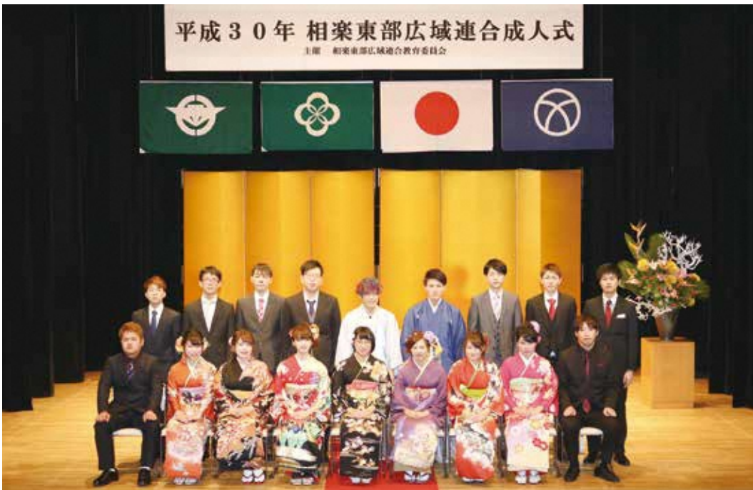
和束中学校区の新成人（和束町）

1月8日、成人の日に相楽東部広域連合教育委員会主催による平成30年成人式がおこなわれ、笠置町・和束町・南山城村で63人が新成人となりました。