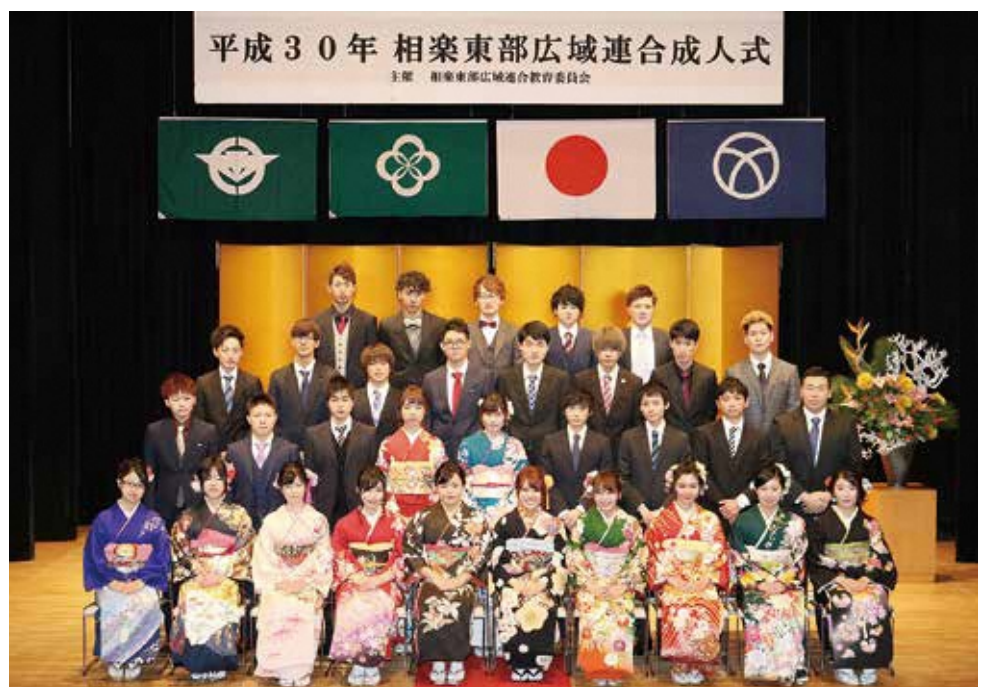
笠置中学校区の新成人（笠置町・南山城村）