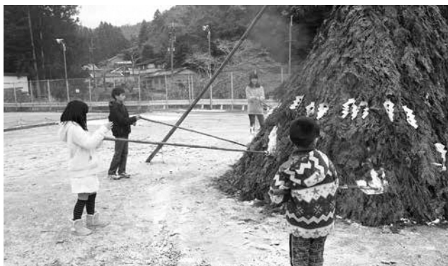
笠置町 西部ふれあい広場

今年は1・2年男子が点火し、火は一気に燃え上がりました。その炭で焼いた餅のぜんざいをいただき、集まった住民の方、保護者や幼児・児童みんなで一年の無病息災をお祈りしました。