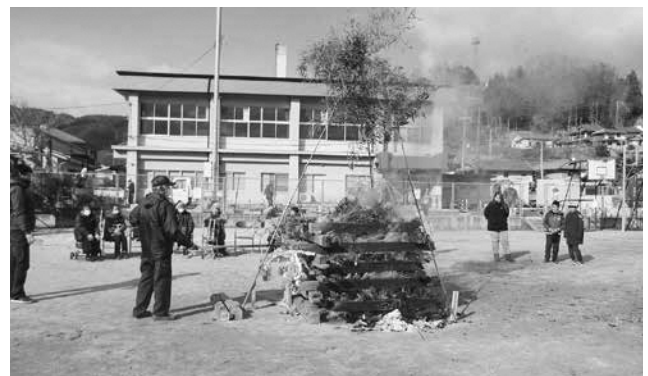
和東町 和東町児童公園