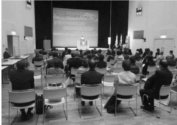
昨年の様子(第39回大会)

日時 2月22日(木) 午後1時～ 場所 南山城村文化会館 やまなみホール 大会内容 (1) 褒章授与及び感謝状贈呈式 (2) 講演 (3) 茶香服大会 など