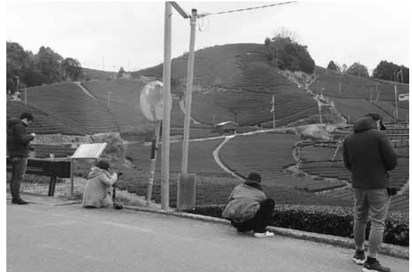
石寺の茶畑前で写真撮影

こうした取組をとおして、多くの方に和束の「生業景観」を知っていただき、和束ファンが増えれば幸いです。