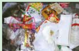
プラスチック容器包装ごみに混ざっていた紙類・ペットボトル類