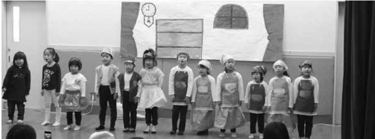
「こびとのくつや」の劇をがんばりました

12月22日（金）、笠置保育所でクリスマス会がおこなわれました。子どもたちの元気いっぱいの歌や劇の発表を見て、保護者をはじめ見ている人たちみんなが幸せになれるクリスマス会になりました。子どもたちの元気いっぱいの発表のあと、サンタさんが登場し、1年間一生懸命がんばった子どもたちにプレゼントを贈りました。今年も笑顔あふれる楽しいクリスマス会でした。