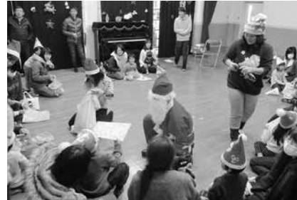
サンタさんからのプレゼント