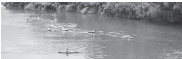
カヌー体験の様子

好天に恵まれた7月10日(月)、笠置中学校2年生は校区内を流れる木津川で、町内のフジタカヌー研究所インストラクターの指導の下、カヌー体験をしました。小学校で体験していたこともあり、平水面での練習に余裕を感じ取れました。仕上げは学習のまとめとして約6kmのカヌーツーリングにチャレンジしました。川の深さや流れを見とり、何よりも自他の安全を確保。カブでのコース取りなどに注意しながら、全員が無事ゴールしました。川面から見る非日常の景色は格別なもので、地元の魅力を再確認する機会となりました。