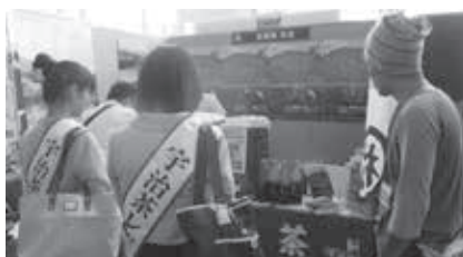
「茶源郷 和東」ブース