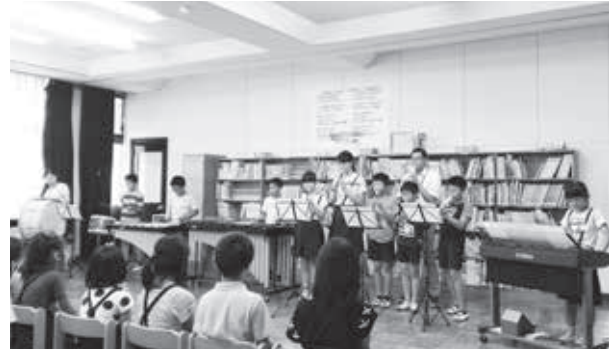
ゆずボンズによる「栄光のかけはし」

参加した児童から「今から来年のミュージックフェスティバルが楽しみ!」という声も聞かれ、児童たちにとってかけがえのない思い出となりました。