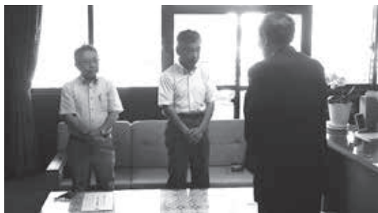
南山城村人権擁護委員委嘱式

南山城村では、月1回の人権相談、8月の人権教育研修会、12月の街頭啓発、人権の花運動による球根等配布をはじめとした啓発活動をおこなっております。(お問合せは南山城村総務課 ☎0743・93・0102まで)