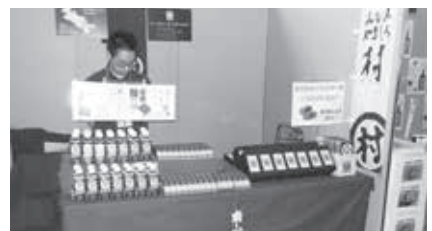
道の駅「お茶の京都 みなみやましろ村」ブース