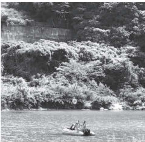
ドローンから浮環を受け取る様子