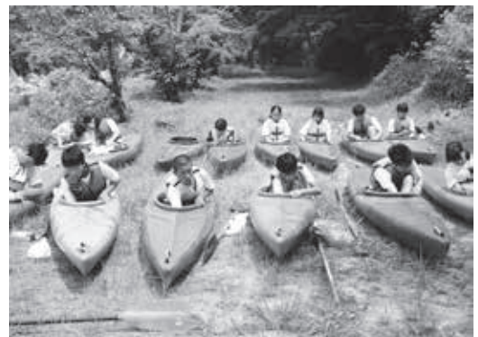
足先の器具を調整する様子