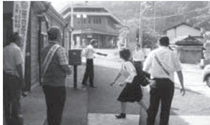
JR 笠置駅で街頭啓発（笠置町）

7月は、社会を明るくする運動の強調月間です。その一環として、笠置町では7月12日（水）、早朝よりJR笠置駅で街頭啓発がおこなわれました。