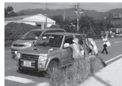
犯罪のない明るい社会 街頭啓発で訴え（和束町）

が通勤通学途中のドライバークラスや学生らに啓発パンフレットや啓発物品を配りながら、運動への協力を求めています。