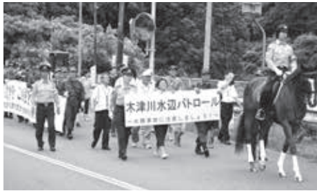
木津川水辺パトロールの様子

主催の木津警察署、相楽中部消防組合消防本部や笠置町消防団などから多くのみなさんが参加し、京都府警の平安騎馬隊や音楽隊の先導のもと、笠置小学校から笠置キャンプ場までの道のりを歩き、水難事故「0」を訴えました。