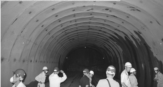
トンネル掘削の最前線を見学