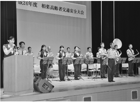
警察音楽隊の演奏もありました。

交通事故を減少させ、かけがえのない命を守るためには、警察署をはじめ、行政、地域、学校などが連携し対策を講じなければなりません。