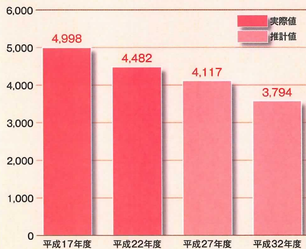
総人口の推移（現状推移型の推計）

また、年齢3区分別の構成比においても、今後少子高齢化がいつそう進み、平成32年度には年少人口（0～14歳）は7.9%に、生産人口（15～64歳）は47.7%とともに減少し、老年人口（65歳以上）は44.4%に増加すると見込まれています。