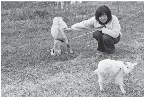
南山城村自然の家のヤギランド

これからも、南山城村自然の家を拠点に、自然豊かな南山城村の魅力を発信・発信をしていきたいと思っています。また、インバウンド対応や外国人向けに情報発信もしていきたいと考えています。みなさん、どうぞよろしく願いいたします。