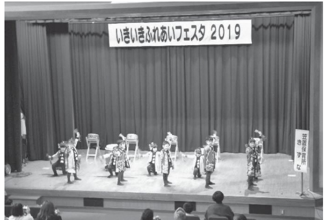
笠置保育所 舞台「なるこ」

今年度も「笠置さわやか会」と共同開催したところ参加者は約150人にのぼり、大盛況の1日となりました。