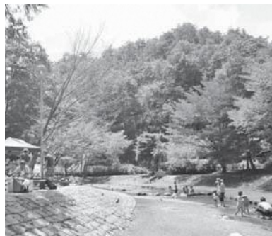
湯船森林公園バーベキューエリア

多くの人々が笑顔になれるような公園づくりを目指して、これからも活動を続けていきたいと思っています。