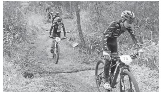
昨年レース時の様子