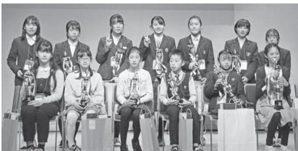
主張大会集合写真