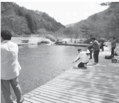
湯船森林公園フィッシングエリア