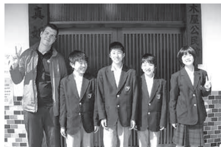
和東中学校の生徒と一緒に

仕事の都合で日本に戻ることがあると思いますので、その時は必ず和東町を訪れます。素敵な五年間、本当にありがとうございました。