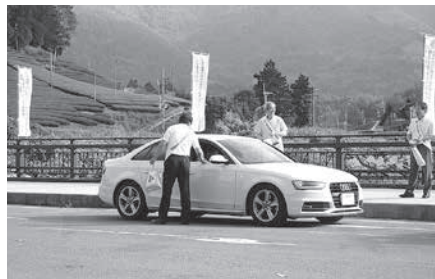
和束町白栖橋交差点付近で街頭啓発 (和束町)

この日は和束町社会を明るくする運動連絡協議会を構成する各種団体の代表ら20人余りの方が通勤通学途中のドライバーや学生らに啓発パンフ