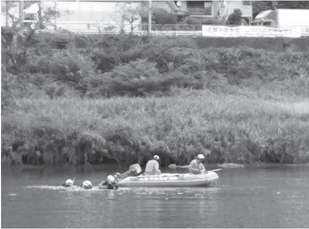
潜水・ボート訓練の様子