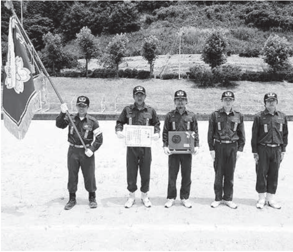
優勝した南山城村消防団代表チーム