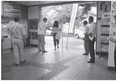
JR 笠置駅で街頭啓発 (笠置町)

社会を明るくする運動は、すべての国民が、犯罪や非行の防止と罪を犯した人たちの更生について理解を深め、それぞれの立場において力を合わせ、犯罪や非行のない明るい社会を築こうとする全国的な運動です。