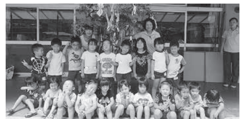
和東保育園七夕会(和東町)

こどもたちは、「今日は天気がいいから、おり姫とひこ星がお空であえるね」と夜空を見上げるのを楽しみにしていました。