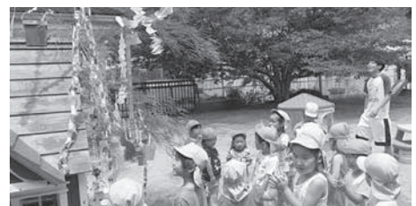
完成した笹に大きな歓声が湧く様子(笠置町)

こどもたちが星つづりや輪っか飾りなどを作り、願い事を書いた短冊をつけました。愛らしい願いごとをした後、元気な声で「たなばたさま」を歌い、七夕の風情あふれる良い時間を満喫しました。また6日には彦星と織姫の紙芝居劇もおこなわれました。