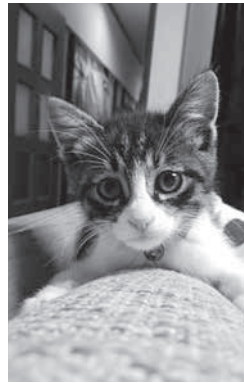
案内人を頑張る笠やんRくん

観光大使として笠やんはゆるキャラグランプリにエントリーしていますので、是非投票をお願いします。詳しくは下記をご覧ください。