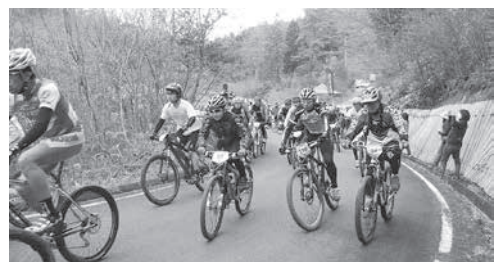
昨年レース時の様子