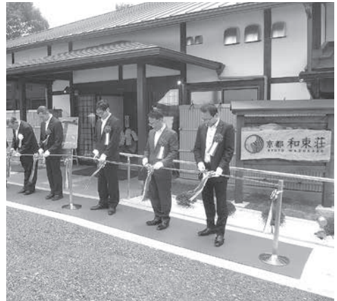
オープンを祝いテープカット

京都和束荘としての新たなスタートに京都府をはじめ、多くの関係者のみなさまにご支援ご協力をいただきましたことに感謝し、今後もこれまで以上の施設のご利用をお待ちしております。