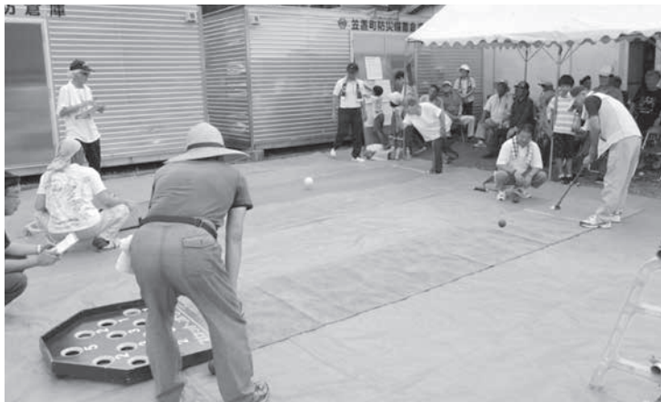
スポーツ大会に励む東部区の参加者

7月3日(日)、笠置町東部区第18回スポーツ大会が開かれました。笠置町の東部区民が東部集会所に集まり、ミニボウリング、スカットボール、競技輪投げを行いました。