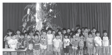
南山城保育園七夕まつり(南山城村)

こどもたちが笹を飾りつけたり、保育園の畑で収穫できた夏野菜を供えたりし、七夕の雰囲気味わいながら、楽しい時間を過ごすことができました。