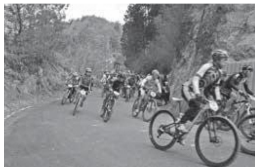
昨年レース時の様子

日 時 3月18日(日) 開催地 和束町湯船森林公園内「ゆぶねMTB LAND」 募集期間 3月10日(土)まで 参加費 一般5500円・中学生2000円・小学生1500円 他 申込み ゆぶね MTB Project ホームページアドレス http://main.846.info ☎0740・22・2256 問合せ 和束町地域力推進課 ☎0774・78・3002 (直通)