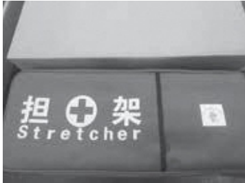
四つ折りストレッチャー