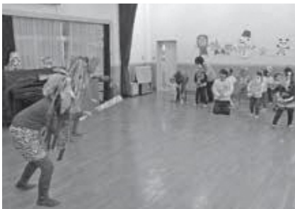
笠置保育所節分行事 みんなで鬼を追い払いました

南山城保育園では、年長児が自分たちで作った鬼の面をつけ鬼役となり、他のクラスの園児が豆まきをしました。しばらくすると、園長が扮した“鬼の親分”が登場。みんなで元気いっぱい「鬼は外！福は内！」と豆をまき、鬼を追い払いました。