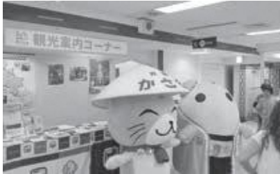
笠やんとたままる(笠置町)

南山城村はアンケート抽選会をおこない、景品として手作りの民芸品をプレゼントしました。また、道の駅お茶の京都みなみやましろ村も出展し、抹茶ソフトクリーム目当ての人で賑わっていました。