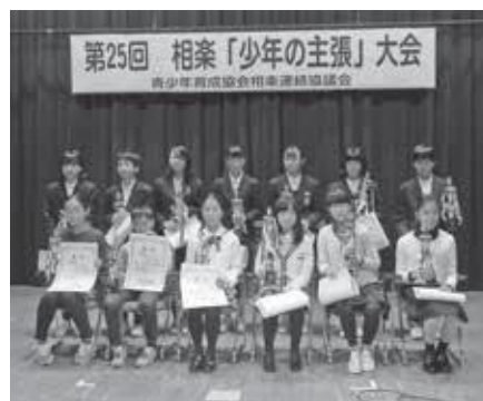
主張大会集合写真