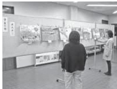
笠置町支部作品展・学生の部

木津川を美しくする会笠置町支部では、清掃活動や作品展等を通じて、木津川の景観保全・啓発活動を推進していきますので、ご協力お願いします。