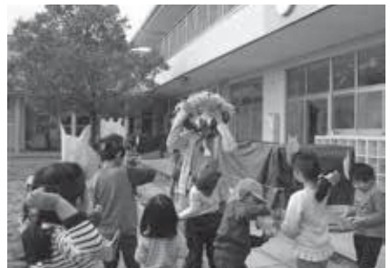
南山城保育園では園庭で豆をまいて 鬼を追い払いました