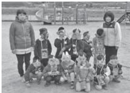
和束保育園園庭で記念写真