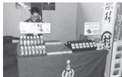
道の駅「お茶の京都みなみやましろ村」ブース