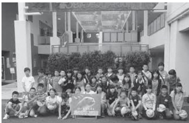
修学旅行(3小学校合同)

この無償化を実施するにあたり、平成30年度は連合全体で約2200万円の予算が必要になり、同予算案は相楽東部広域連合議会に提出します。来年度予算が可決されれば、平成30年4月から実施します。