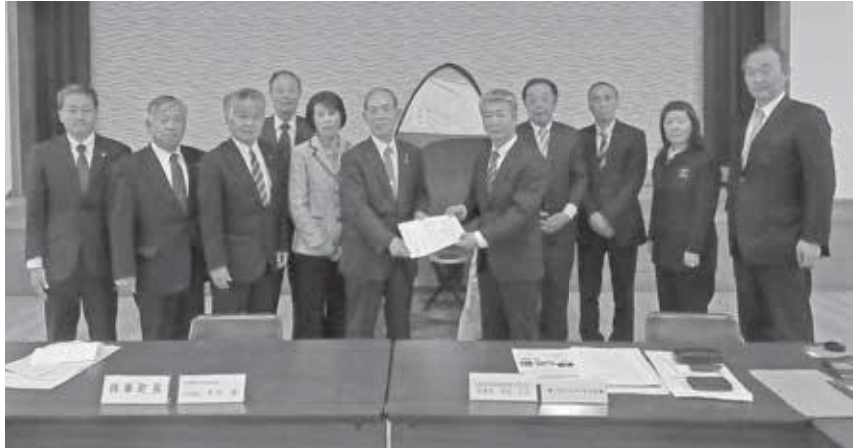
相楽会館での確認書調印式の様子

災害用トイレは笠置町に10基、和束町に10基、南山城村に15基それぞれ無償貸出を受けました。ありがとうございました。