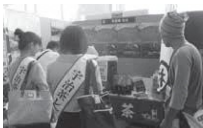
「茶源郷 和束」ブース