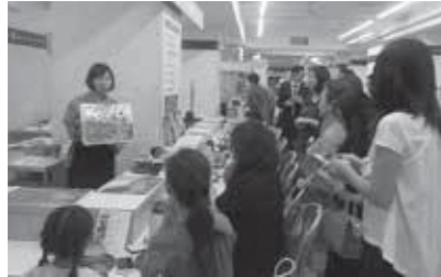
抹茶アート講座(和束町)