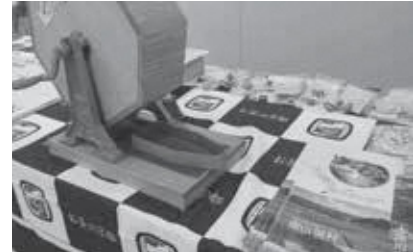
アンケート抽選会(南山城村)