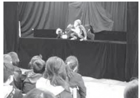
人形劇「さるかに合戦」