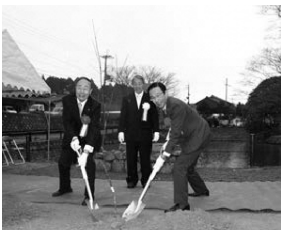
西脇知事も参加してもみじを記念植樹

また、もみじの郷として地域外の方に訪問していただけるきっかけづくりとしようと、もみじの記念植樹もおこなわれました。