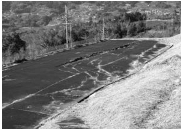
敷地の変状の状況

べきとの意見もいただき、専門家からの意見、顧問弁護士との協議もふまえ、議会の承認を経て、平成19年2月22日、京都地方裁判所に工事請負業者らに対し、民法第709条不法行為（義務違反）による損害賠償請求（約5億4千万円）の訴えを提起しました。