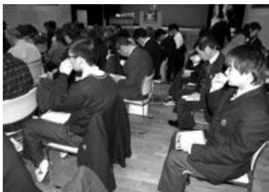
茶香服大会の様子