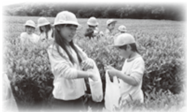
(相楽東部広域連合教育委員会)

地方創生において教育の果たす役割が極めて大きい折り、相楽東部に愛着を持つ子どもたちを社会総がかりで育てていくたく、御協力方よろしくお願います。