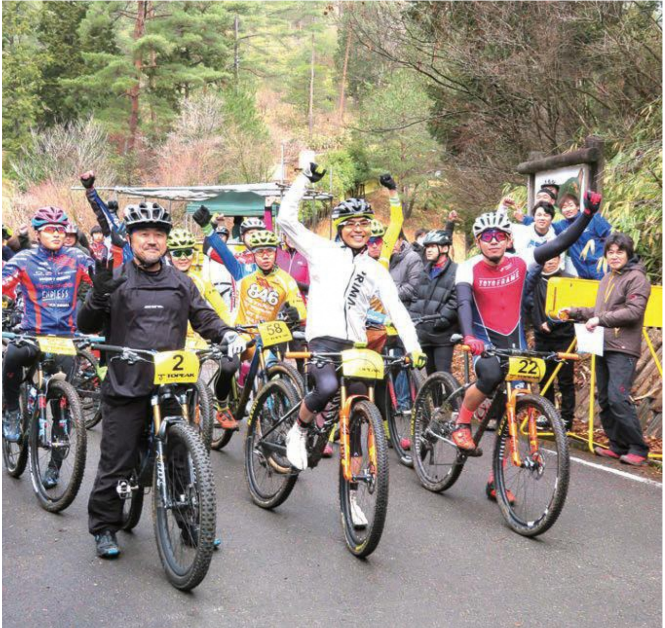
京都ゆぶね「春よ恋ひ」エンデューロ (和束町湯船森林公園内「ゆぶねMTBLAND」)