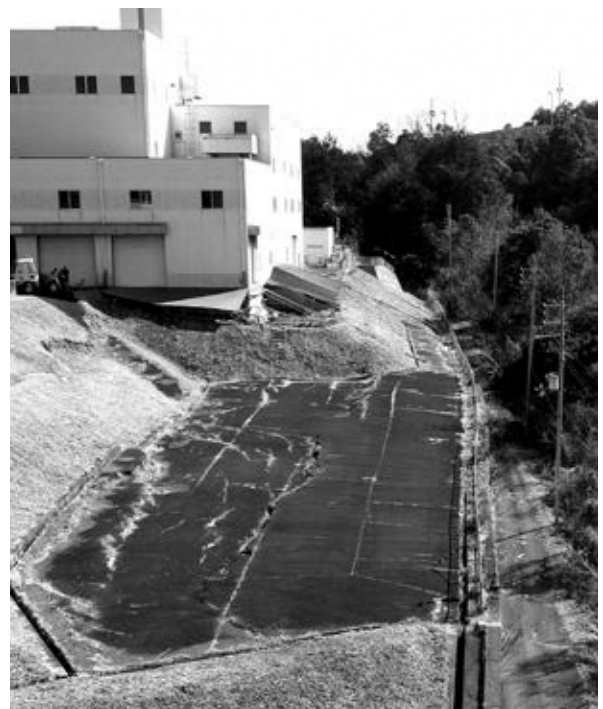
擁壁と隣接する町道の状況