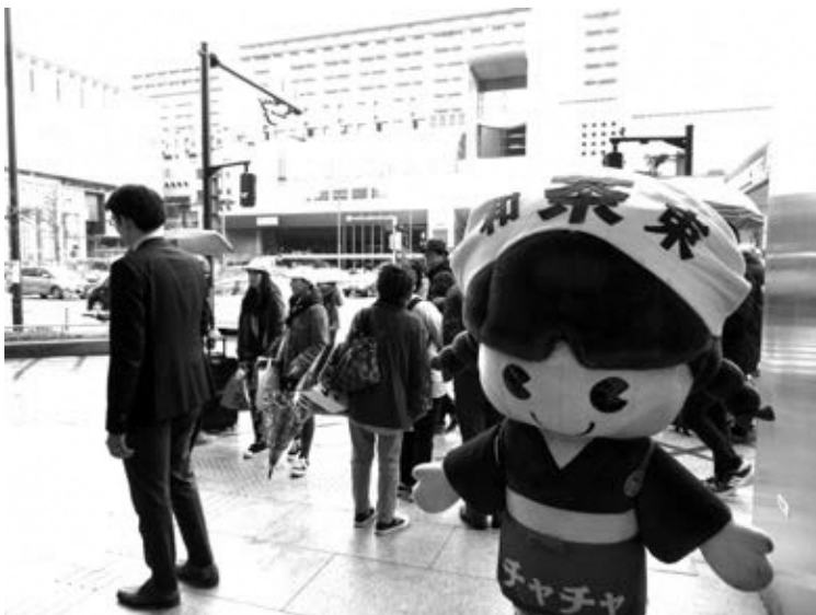
京都駅前の京都タワーで和束町をPRする茶茶ちゃん

和束町は展望室1階のウェルカムコーナーで自治体PRブースとして和束茶の試飲・販売、観光PR、茶茶ちゃんによるじゃんけん大会をおこない多くのお客さんと賑わいました。