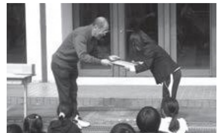
笠置小学校贈呈式の様子