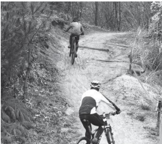
山を駆け上がる選手たち

大会を通じて大きな怪我もなく、レース終了後は満足していただけた様子で2021年に開かれるワールドマスターズゲームズの弾みになる素晴らしい大会になりました。