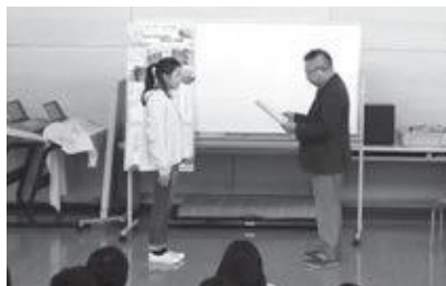
児童の代表に感謝状を贈呈(南山城小学校)

こどもたちは球根から水仙の花を咲かせることで、命の大切さや思いやりについて学び、人権について理解を深めるいい機会となりました。