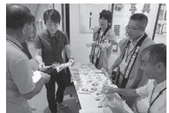
やまなみホールでの啓発の様子