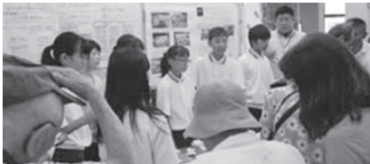
1年生 サギソウの学習掲示の様子

笠置中学校では、地域の自然や文化について学び・考える「ふるさと学習」を通じて、これからも地域の魅力を伝えるとともに、その振興に取り組んでいきます。