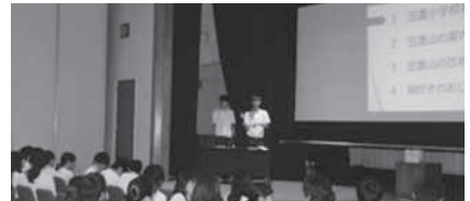
3年生 ふるさとクイズの様子