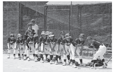
南山城オールスターズ