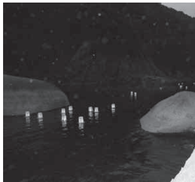
流れゆく灯ろうの様子