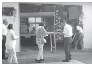
「知ろう・守ろう・考えよう」街頭啓発の様子（JR笠置駅前）

南山城村では、8月2日（火）にやまなみホールで人権教育研修会を開きました。「介護と人権」をテーマに講師をお招きし講演・DVD上映・啓発をおこないました。