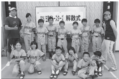
笠置ブルースターズ

8月6日（土）、和束運動公園において第47回相楽小学生ソフトボール大会が開かれました。管内3町村からもそれぞれ1チームが出場し、夏休みの早朝や猛暑の中、一生懸命練習に励んできた成果を存分に発揮しました。大会には全7チームがエントリーし、AゾーンとBゾーンに分かれて、トーナメント戦とリーグ戦をおこないました。管内のチームでは、Aゾーンで南山城オールスターズ（南山城小）が、Bゾーンで和束ファイターズ（和束小）がそれぞれ準優勝に輝きました。