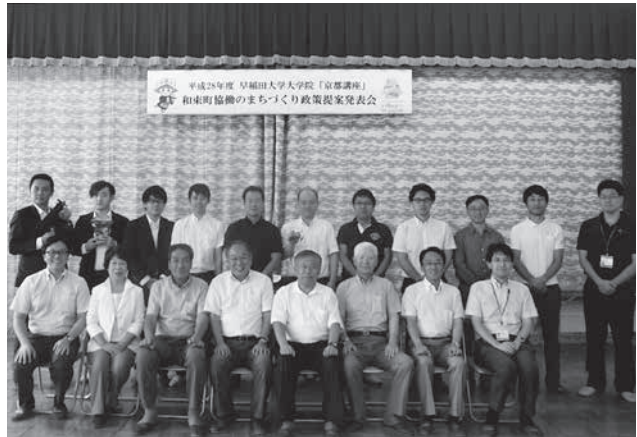
政策提案発表会で集合写真（和束町社会福祉センター）

早稲田大学大学院のみなさん、住民のみなさんにおかれましては6日間ありがとうございました！