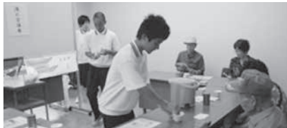
2年生 お茶の淹れ方講座の様子