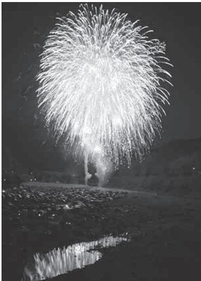
キャンプ場から打ち上がる花火の様子