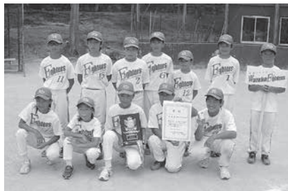
和束ファイターズ