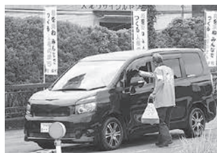
和束町白栖橋前交差点で街頭啓発活動