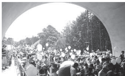
たくさんの来場がありました。

一般国道163号北大河原バイパスの開通を前の8月14日（日）にバイパスのトンネルウォーキングイベントを開きました。