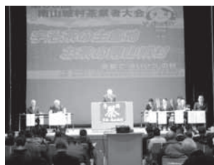
茶業者大会の様子