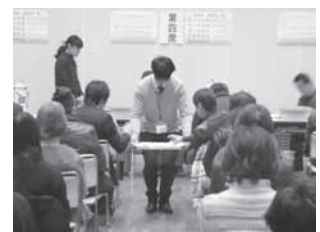
茶香服大会の様子