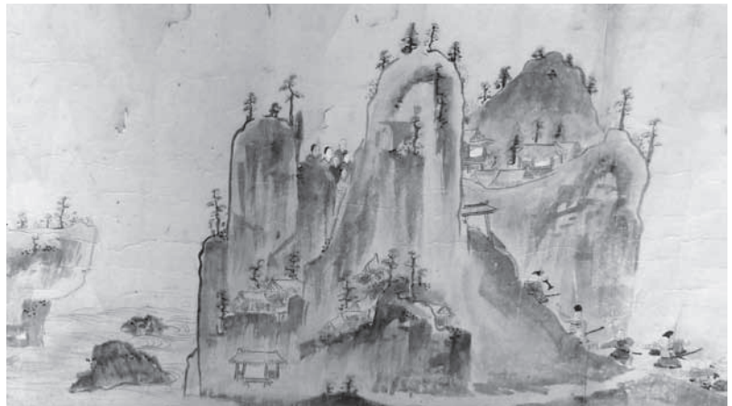
笠置寺縁起の一場面

この縁起には、寺の創建から南北朝の動乱までの歴史が記されており、南山城の縁起としては中世に遡る数少ない例だと言われています。史料の多くが失われた当寺において本作が伝わってきた意義は大きく、また太平記を描く早期の作例としても注目されています。