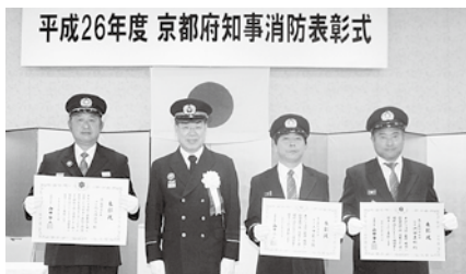
平成26年度 京都府知事消防表彰式