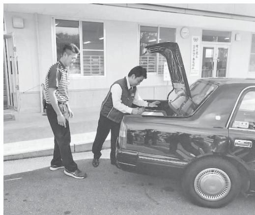
タクシーに荷物を詰め込む様子