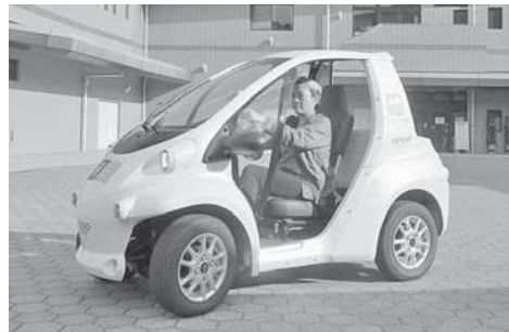
コムスに乗っている様子

問合せ・予約・受渡場所 天然温泉わかさぎ温泉 笠置いこいの館 ☎ 0743・95・2892 (代表) ☎ 0743・95・2821 休業日 第一と第三水曜日と年末年始