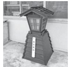
植田さん手作り灯ろう

また、全面に「火の用心」と「特別警戒実施中」の入替可能な文字板が付けられており、火災予防の啓発にもなっています。