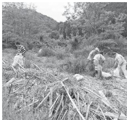
南山城村やまなみホール下河川敷