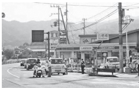
和東町白栖橋前交差点で街頭啓発

が通勤・通学途中のドライバークラスや学生らに啓発パンフレットや啓発物品を配りながら、運動への協力を求めています。また2日(月)に保育園・小学校を、3日(火)に中学校を訪問し、児童・生徒に一言ずつメッセージを伝えました。