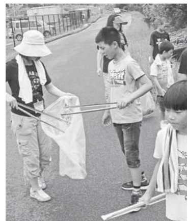
南山城小学校周辺道路のごみ拾い