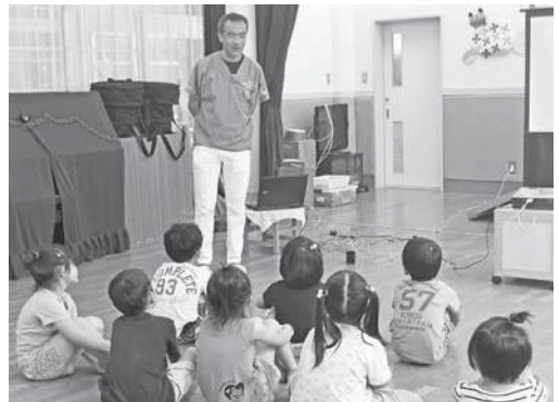
歯科医の先生の話きく子どもたち

子どもたちだけではなく、むし歯予防のためには「大人もフッ化物入り歯磨き剤を使うことがおすすめ」とのことでした。