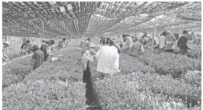
摘み手のみなさんのご協力が出品茶を支えています