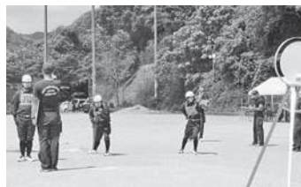
優勝した第1部の競技の様子