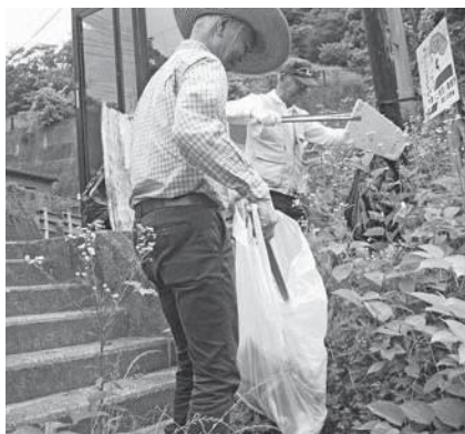
笠置町木津川河川敷

今後も木津川の景観を守り次世代に残していくため木津川を美しくする活動に取り組んでいきます。