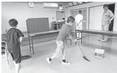
今山公民館での清掃

振り返りの場面では、「地域の人に喜んでほしい」、「自分の地区以外の公民館に行けたのがよかった」、「すごくきれいに使われているのでびっくりした」といった感想を交わしていました。