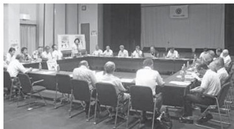
笠置町推進委員会の様子

啓発活動には和東町社会を明るくする運動連絡協議会を構成する各種団体の代表ら20人余りの方が