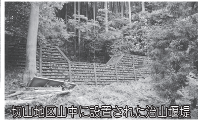
切山地区山中に設置された治山堰堤