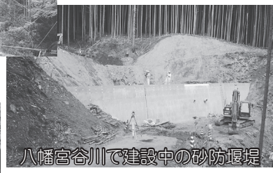
八幡宮谷川で建設中の砂防堰堤