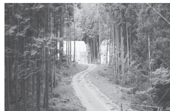
▲不動谷川で建設中の砂防堰堤

県南部で大きな土砂災害が発生したのは記憶に新しいが、相楽東部管内でも昭和二十八年や昭和六十一年に大きな土砂災害が発生しています。