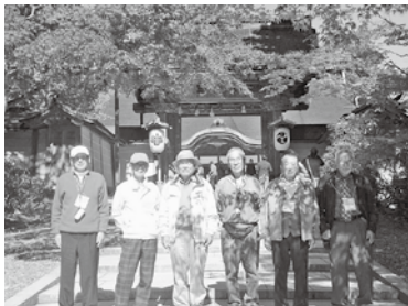
やまなみ大学社会見学

一方、南山城村では、10月24日(金)にやまなみ大学の社会見学が実施され、ひと足早く色づきはじめた秋の高野山を散策。11月1日(土)に開催された南山城村文化協会主催の文化ツアーでは、延暦寺や清水寺などを巡り、紅葉狩りを楽しみました。