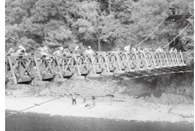
笠置町民歩こう会

また、11月21日(金)には笠置さわやか会の社会見学が行われ、紅葉が映える爽やかな秋空の下、東映太秦映画村や嵐山周辺を散策しました。