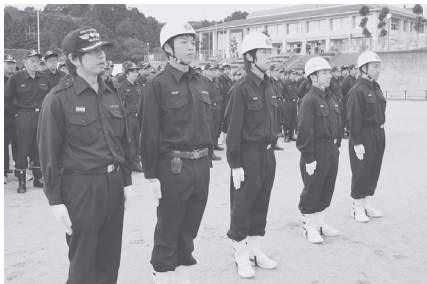
優勝に輝いた 西分団チーム