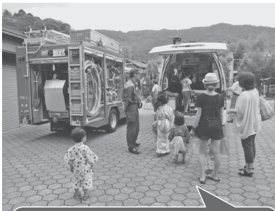
子どもたちに大人気の緊急車両

当日は、まだ梅雨明けぬ曇りがちな天候でしたが、浴衣を着た大勢の参加者も忘れさせてくれるほど、会場を賑やかな雰囲気にしてくれました。