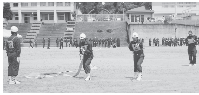
操法は、消防器具操作の基本動作で、実際の火災現場を経験すると、操法練習で身についたひとつひとつの動作が本当に生きてくると実感します。

は消防操法の夏、4人1チームで、規律と消防器具操作、そして正確な速さを競う競技。私も今から28年前の夏、2番員として出場した経験があります。練習