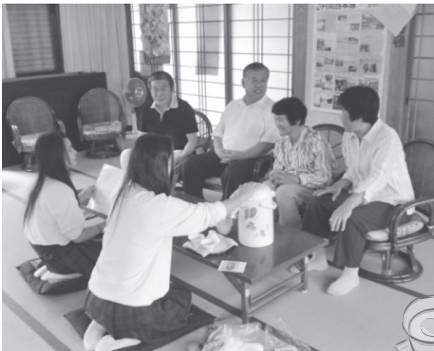
門前区での新茶会

七月十三日、そのお茶学習の一環として、生徒が地元の人たちに新茶をふるまう「新茶会」を町内十五カ所で開催しました。新茶会では生徒が自ら摘み取ったお茶をふるまいながら、地元の人たちとふれあういい機会となり、終始和やかな雰囲気でした。