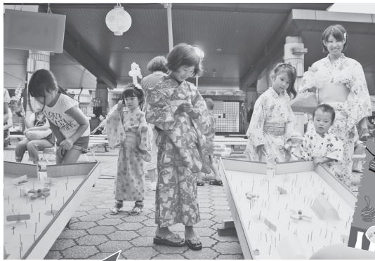
子どもたちも浴衣で来てくれました。

連合という組織の中で、三町村のつながりを感じながら、それぞれの地域の温度差を感じたりもまた、今年には計画立案から当日の運営まで、また遊具の制作に取り組みなど、三町村の住民の方々に楽しんでいただく準備を進めてきました。