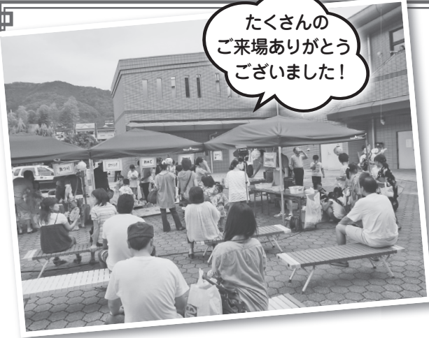
たくさんのご来場ありがとうございました！

七月十四日、笠置いこいの館にて開催した『宵待ち隣町の宵涼み会』もその一環ですが、本事業は、相楽東部広域連合の社会教育委員による、三町村の住民を対象にした、広域的な地域づくりを目指した事業です。