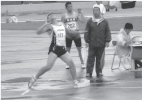
13.94 mの記録で優勝 (7/1)

「僕はこれまで多くの友人や先生に支えられ、こんなに強くなれました。全国では必ず結果を残せるよう頑張ります。」と強い決意を述べてくれました。全国大会での活躍を期待しています。