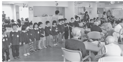
大きな声で自己紹介する園児たち

12月2日(月)、和東保育園の年長児・年中児35人が、特別養護老人ホームわらく内のデイサービスを訪問しました。