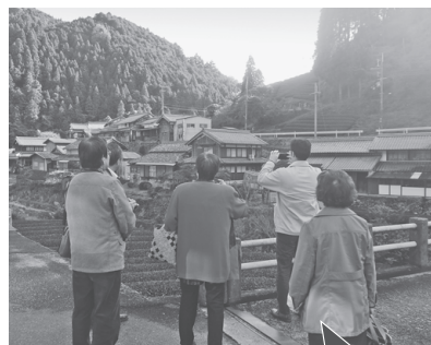
湯船区の集落景観の見学

次にグリーンティ和東に移動し、和東茶と茶団子を味わっていただきながら、和東町から町の概要とまちづくりの取組について説明し、意見交換を行いました。