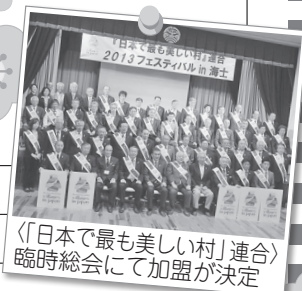
〈「日本で最も美しい村」連合〉 臨時総会にて加盟が決定