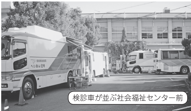
検診車が並ぶ社会福祉センター前

和束町では、受診しやすいがん検診を目指して、11月23日(土・祝)に和束町社会福祉センターで、休日総合がん検診と啓発イベントを開きました。当日は、胃がん、大腸がん、肺がん、子宮頸がん、乳がんの5つの検診が行われました。今回の検診は、京都府山城南