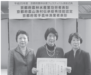
平成25年度 京都府農林水産フェスティバル表彰式典 京都府農山漁村伝承優秀技能認定 京都府若手農林漁業者表彰