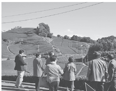
白栖・石寺の茶畑景観の見学

一行ははじめに湯船区の集落景観を見学されました。伝統的な瓦屋根の建造物群と美しい紅葉が織りなす景観に「すごい」「素晴らしい」と口々におっしゃっていました。