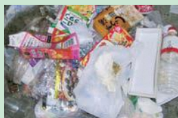
プラスチック容器包装ごみに混ざっていた紙類・ペットボトル類